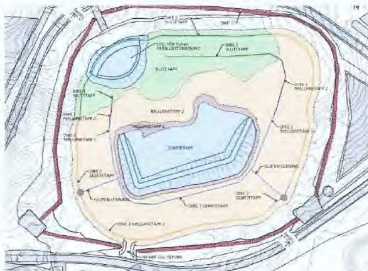
Yhtiön pääkäsittelyssä esittämä kuva.

Pääkäsittelyssä yhtiö ilmoitti, toisin kuin asiakirjoissa todetaan, että hiekka- ja sivukivivaraston pohjapinta voidaan rakentaa vaiheittain ja että vedenpuhdistuksesta tulevan hydroksidilietteen vedenpoisto tapahtuu geoputkissa paikan päällä erillisessä solussa, yhdistetyssä hiekka - ja sivukivivarastossa.