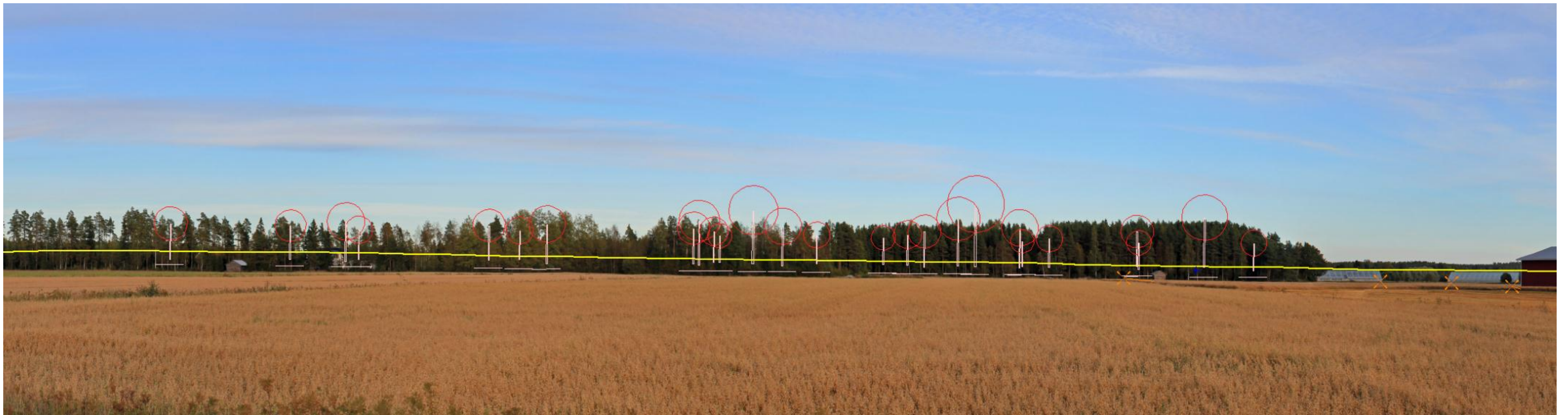
Bild 5 Fotomontage och draft-version från Kronolandsvägen (RV8) Hag i riktning öst. Avståndet till det närmaste vindkraftverket är cirka 2,7 kilometer.