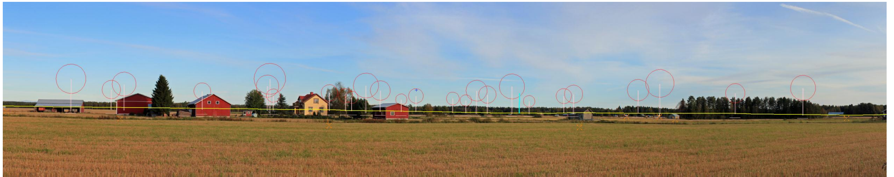
Bild 4 Fotomontage och draft-version från Sjettpottsvägen, Högbäck i riktning sydost. Avståndet till det närmaste vindkraftverket är cirka 2 kilometer.