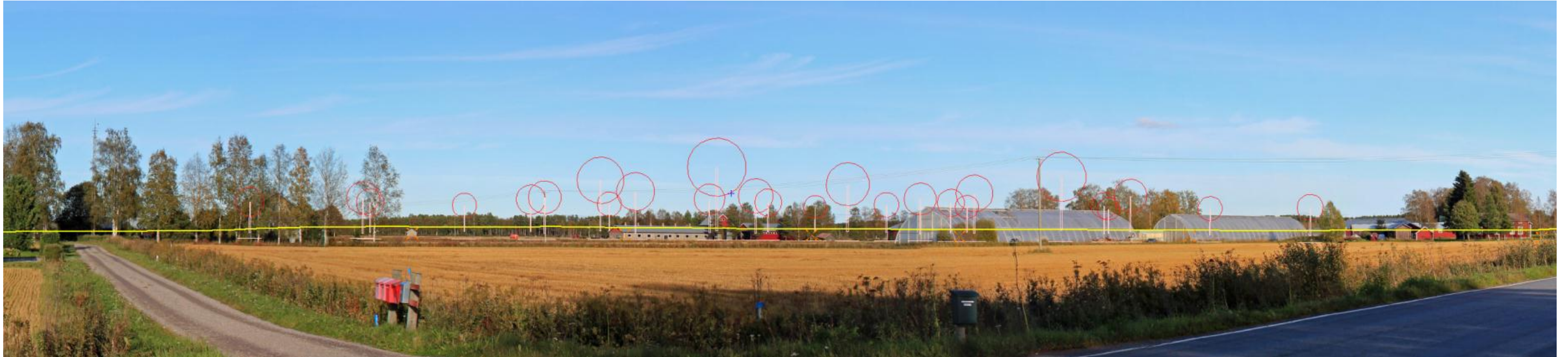
Bild 2 Fotomontage och draft-version från Öster i byn på Österlandsvägen riktning ost. Avståndet till det närmaste vindkraftverket är 2,4 kilometer.