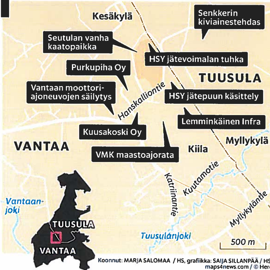
Kuva 1. Kuvituskuva Helsingin Sanomat 31.7.2016 "Kuinka paljon louhintaa, murskaamista ja kierrätystä pieni asuinalue kestää? Hankkeet kiristävät hermoja Vantaan Kiilassa" http://www.hs.fi/kaupunki/a1469848121678

Edellisen jälkeen alueella on toimintansa aloittanut edellisten lisäksi mm. Romu-Keinäsen toimipiste. Kokonaisvaltaisempi tarkastelu alueen kuormituksiin olisi toivottavaa. On ilmiselvää, että ympäristövaikutusten arviointi tulisi suorittaa ainakin Suomen perustuslain 2§ ja 20§ sekä Valtioneuvoston asetuksen ympäristövaikutusten arviointimenettelystä 7§ erityisesti kohdan 1c mukaisesti. Haluaisin uskoa, että ympäristöviranomaisten asiantuntemus riittää Kiilan alueen ympäristöön kohdistuvan kokonaiskuormituksen arviointiin. Luvanhakijoiden osaoptimoitua lupashoppailua ja ympäristösuojelulain hengen halventamista alueen asukkaiden kustannuksella ei tulisi enää sallia.