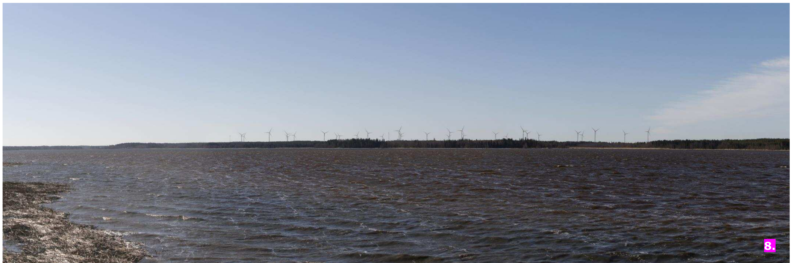
Valokuvasovite 8. Etäisyys lähimpään voimalaan noin 5,5 kilometriä.