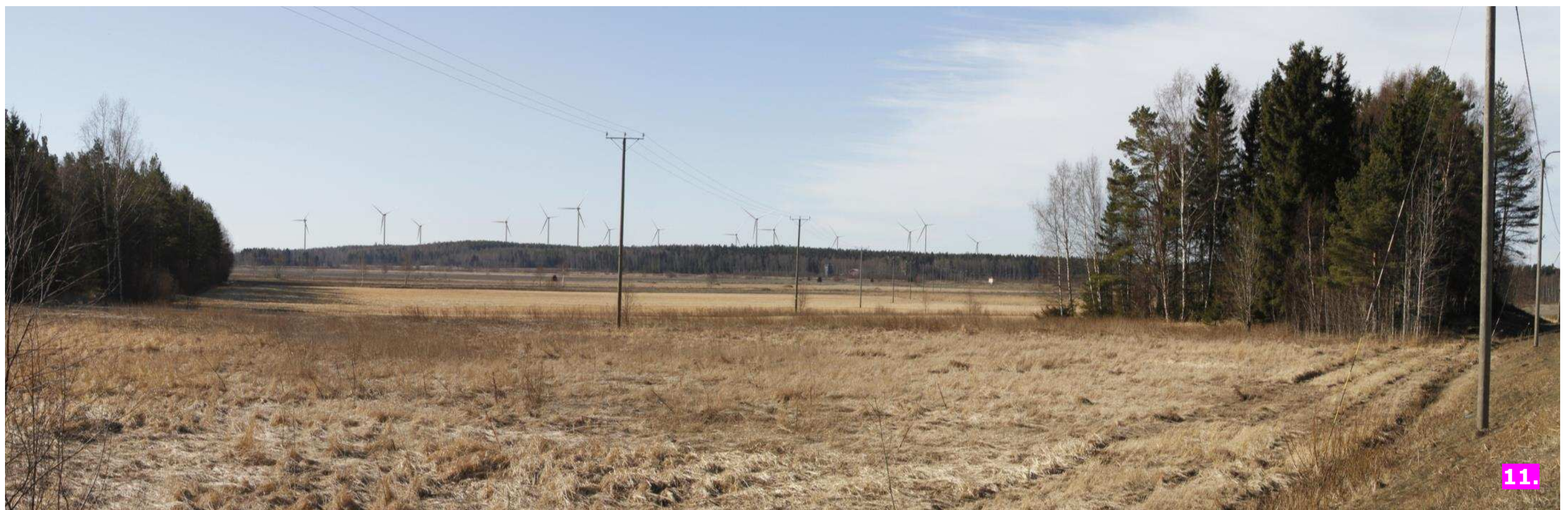
Valokuvasovite 11. Etäisyys lähimpään voimalaan noin 4,3 kilometriä.