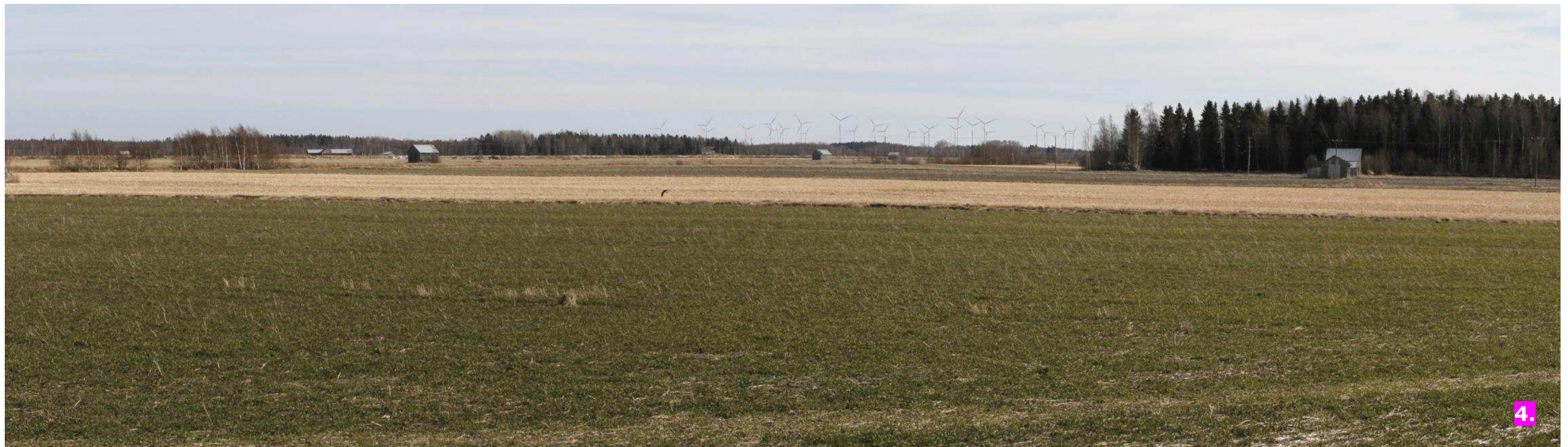
Valokuvasovite 4. Etäisyys lähimpään voimalaan noin 7 kilometriä.