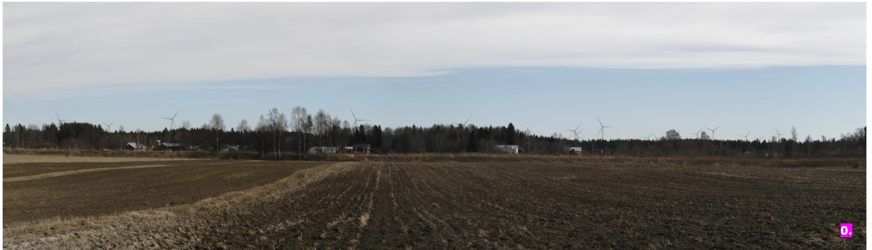
Valokuvasovite 0. Etäisyys lähimpään voimalaan noin 3,3 kilometriä.