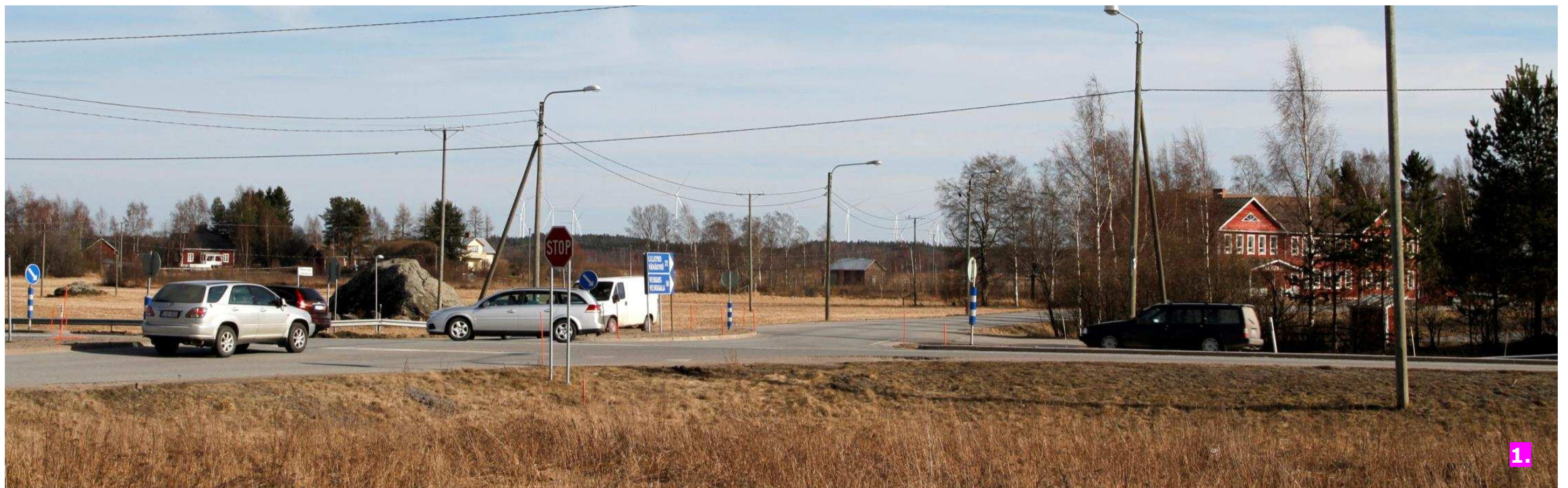
Valokuvasovite 1. Etäisyys lähimpään voimalaan noin 5 kilometriä.