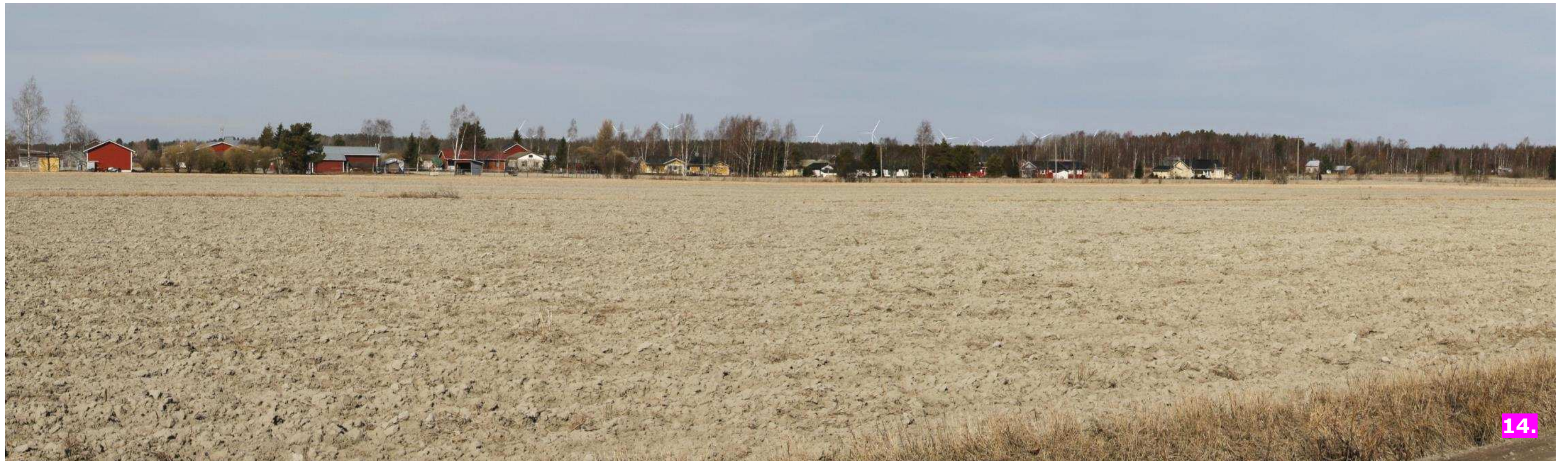
Valokuvasovite 14. Etäisyys lähimpään voimalaan noin 7,6 kilometriä.