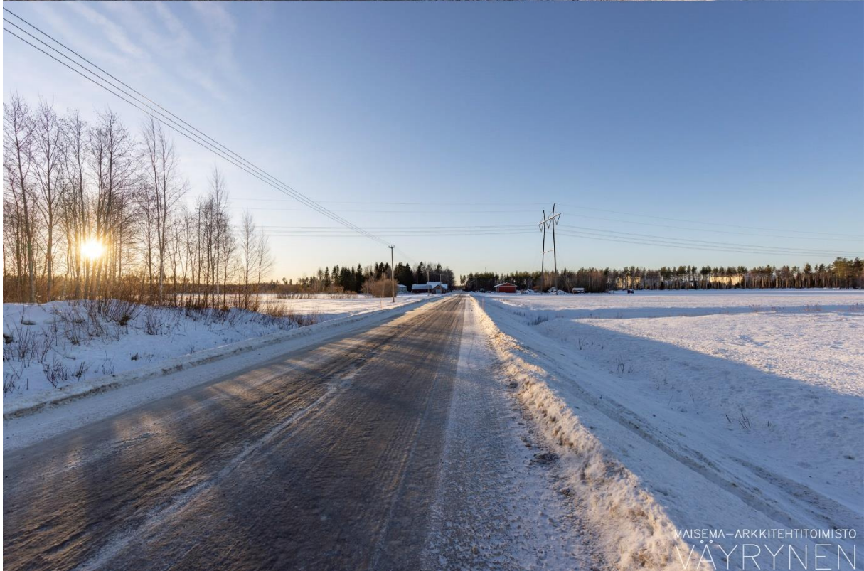
Kuvauspaikka B. Havainnekuva Härkänevantieltä kohti voimajohdon reittivaihtoehtoa SVE3.