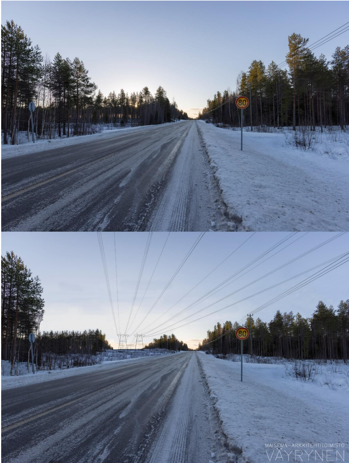
Kuvauspaikka A. Havainnekuva Ullavantieltä (kantatie 63) (SVE1).