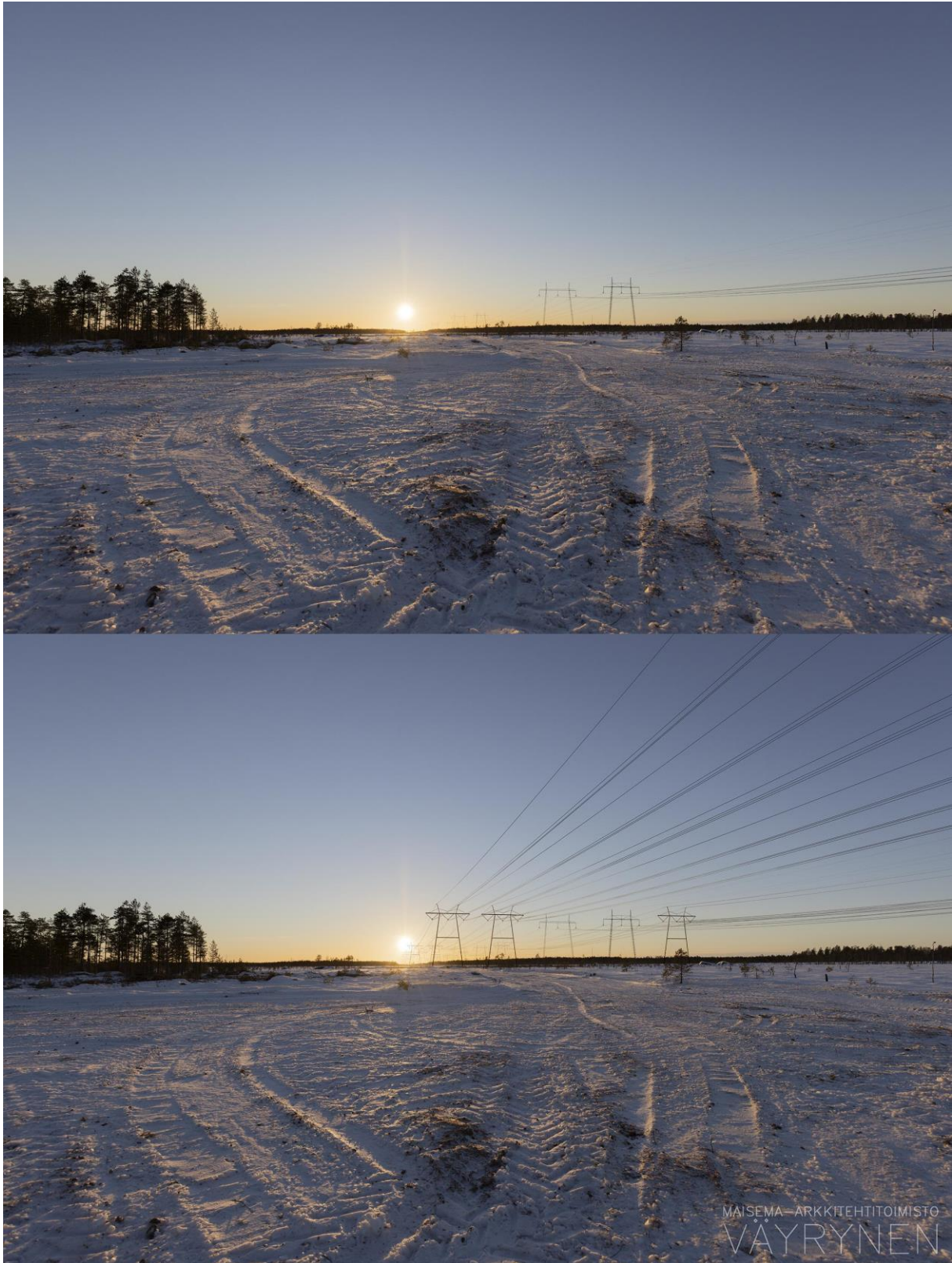
Kuvauspaikka C. Havainnekuva Ahvenlammilta (SVE3).