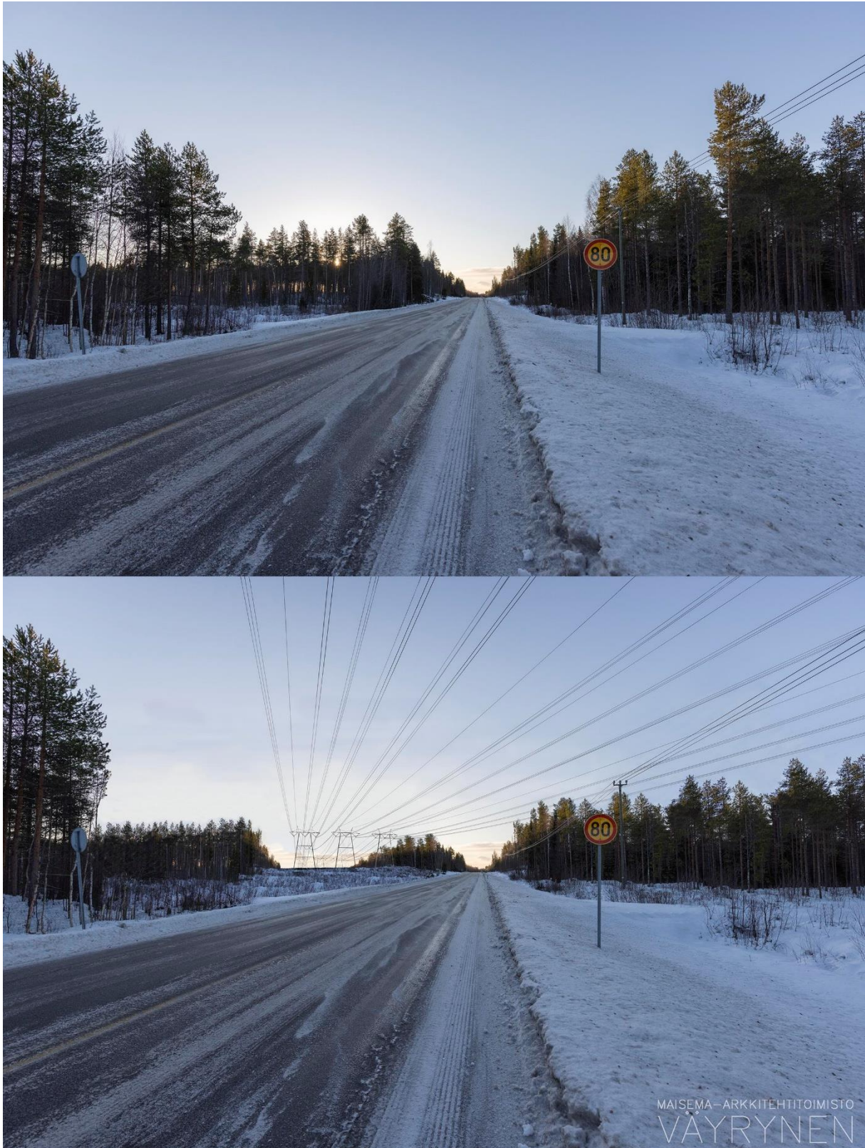
Kuvauspaikka A. Havainnekuva Ullavantieltä (kantatie 63) (SVE1).