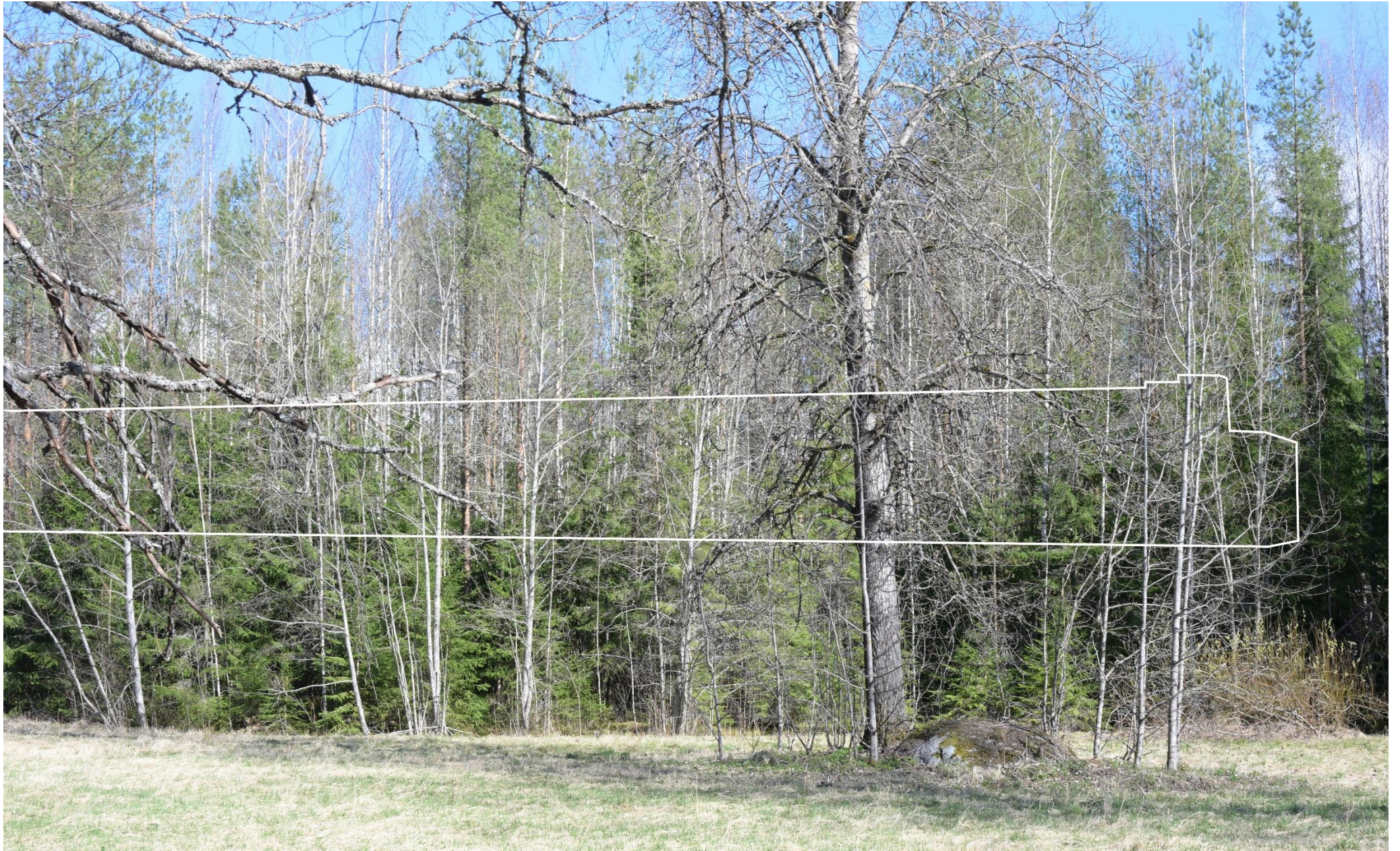
Kuva 6. Havainnekuva Kuuselantieltä kaakkoon kohti datakeskusalueita. Datakeskuksen hahmo on osoitettu valkoisella viivalla.