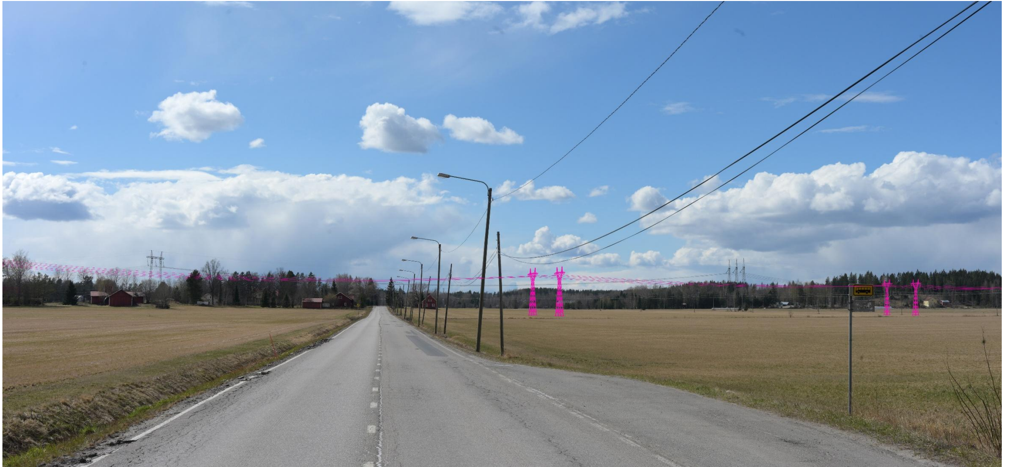
Kuva 14. Havainnekuva Pertuntieltä länteen. Voimajohdot (VE1) on korostettu vaaleanpunaisella.