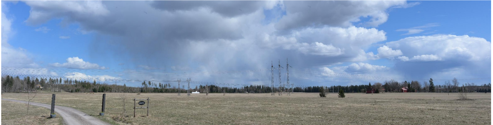
Kuva 7. Havainnekuva Vanhalta Jokelantieltä itään Lehmusvaarankujan kohdalta (VE1).