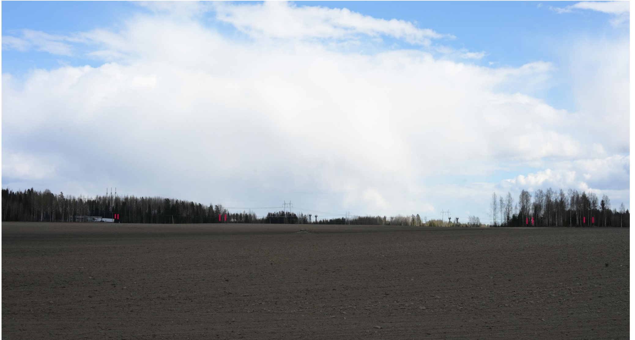
Kuva 19. Havainnekuva Raalantieltä kohti itää (VE1). Puuston taakse jäävät voimajohtopylväät on korostettu punaisella.