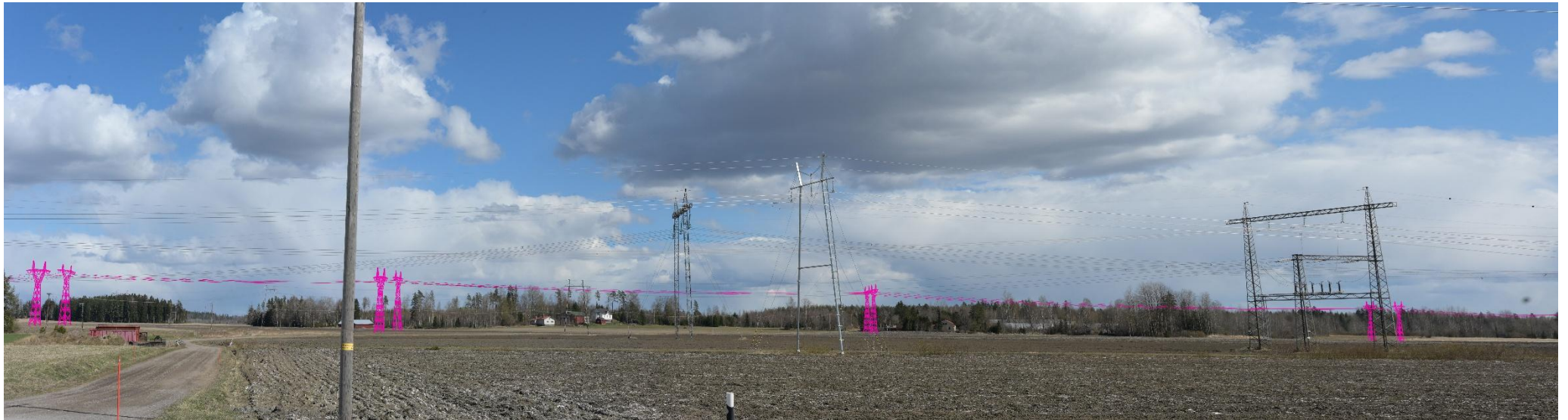
Kuva 18. Havainnekuva Hämeentieltä itään Kuoppanummentien kohdalta. Voimajohdot (VE1) on korostettu vaaleanpunaisella.