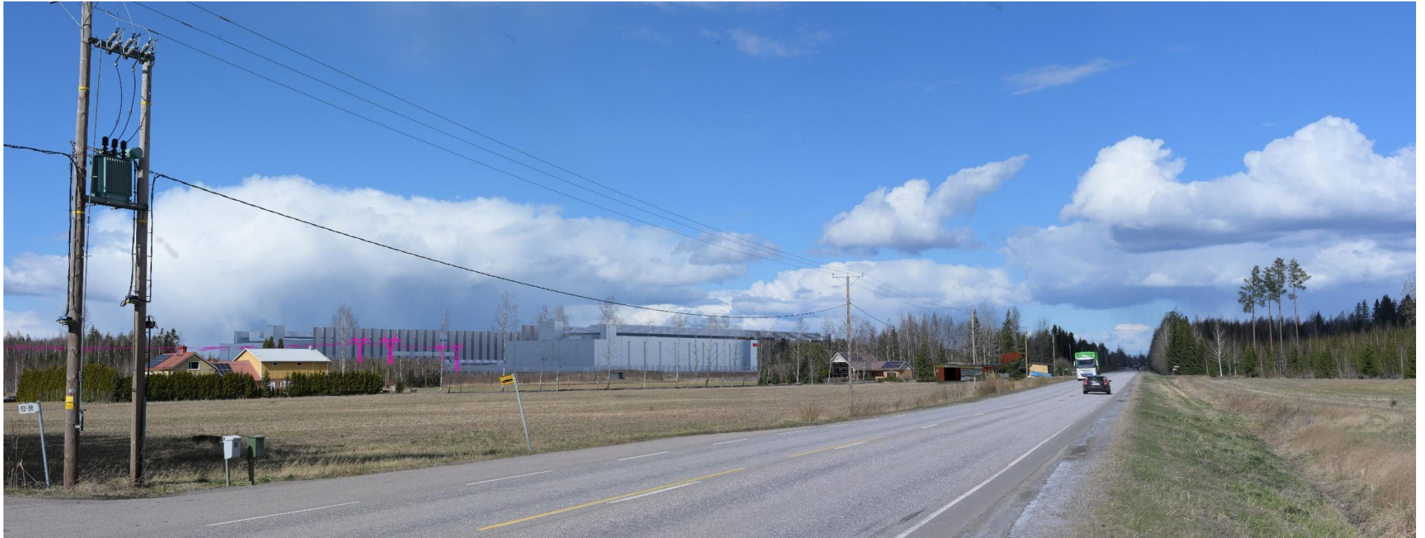
Kuva 3. Havainnekuva Ridasjärventieltä pohjoiseen kohti datakeskusalueita. Voimajohdot (VE1) on korostettu vaaleanpunaisella.