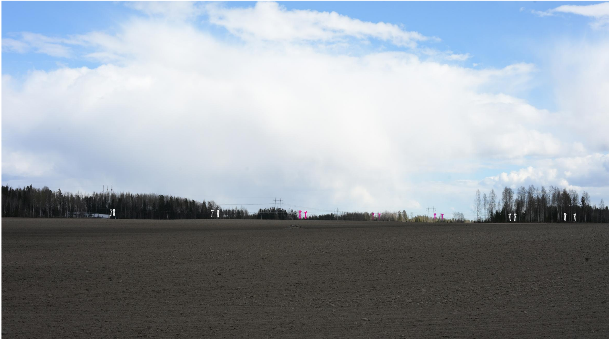
Kuva 20. Havainnekuva Raalantieltä kohti itää. Voimajohdot (VE1) on korostettu vaaleanpunaisella. Puuston taakse jäävät voimajohtopylväät on korostettu valkoisella.