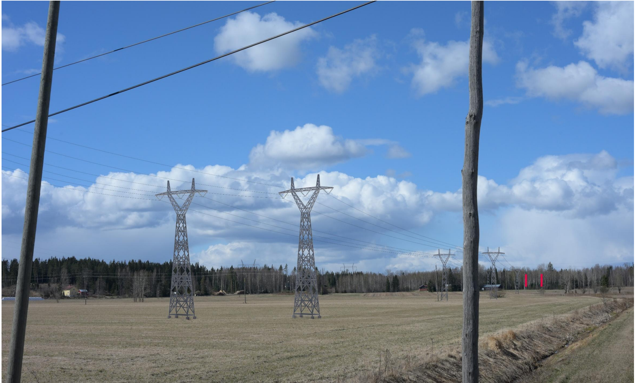
Kuva 11. Havainnekuva Pertuntieltä luoteeseen Ojalantien kohdalta (VE2). Puuston taakse jäävät voimajohtopylväät on korostettu punaisella.