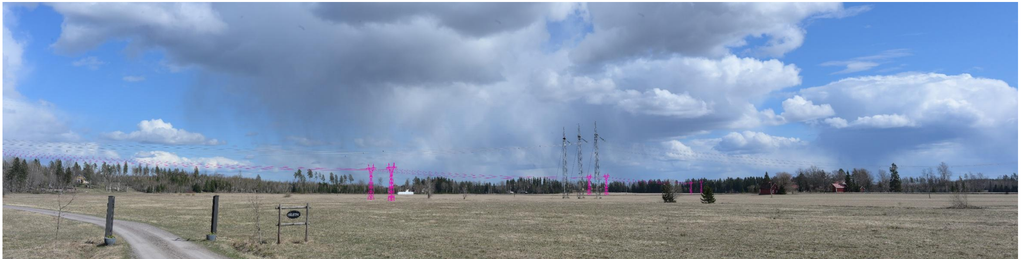
Kuva 8. Havainnekuva Vanhalta Jokelantieltä itään Lehmusvaarankujan kohdalta. Voimajohdot (VE1) on korostettu vaaleanpunaisella.