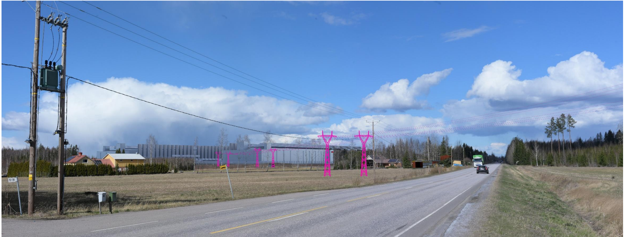
Kuva 5. Havainnekuva Ridasjärventieltä pohjoiseen kohti datakeskusalueita. Voimajohdot (VE2) on korostettu vaaleanpunaisella.