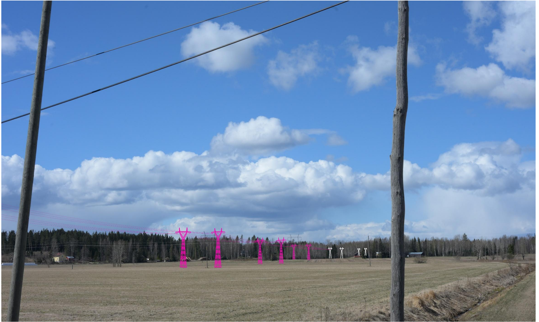
Kuva 10. Havainnekuva Pertuntieltä luoteeseen Ojalantien kohdalta. Voimajohdot (VE1) on korostettu vaaleanpunaisella. Puuston taakse jäävät voimajohtopylväät on korostettu valkoisella.