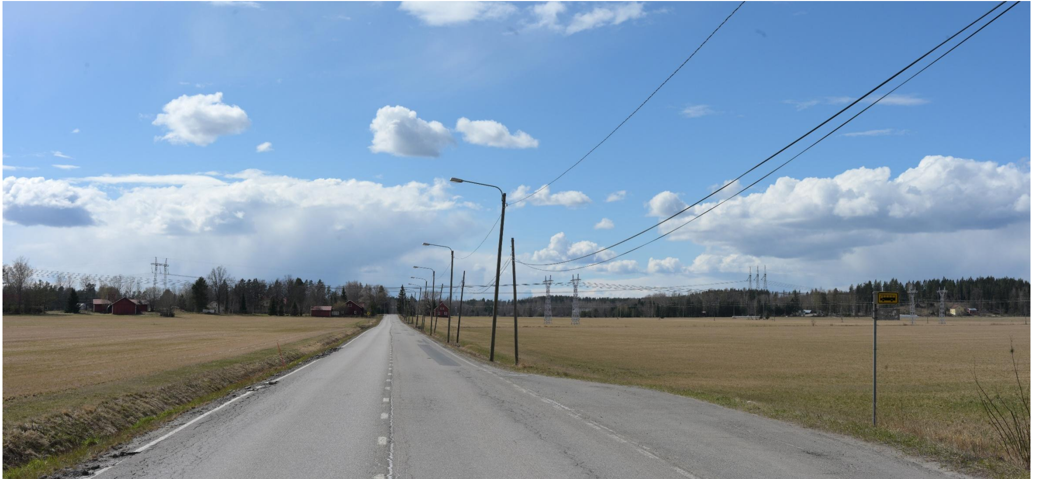
Kuva 13. Havainnekuva Pertuntieltä länteen (VE1).