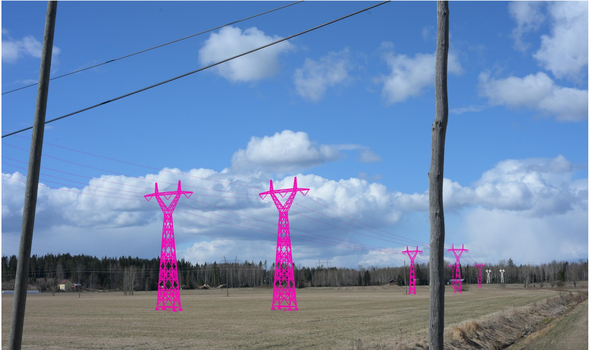
Kuva 12. Havainnekuva Pertuntieltä luoteeseen Ojalantien kohdalta. Voimajohtot (VE2) on korostettu vaaleanpunaisella. Puuston taakse jäävät voimajohtopylväät on korostettu valkoisella.