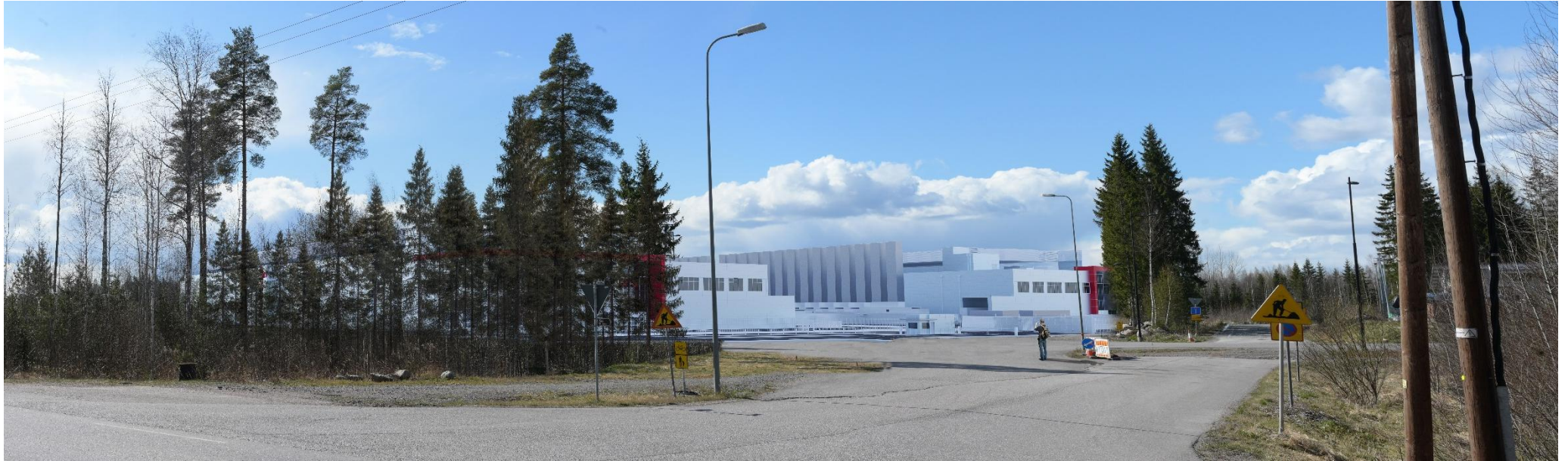
Kuva 1. Havainnekuva Ridasjärventien ja Työkkyrintien risteyksestä itään kohti datakeskusalueetta.