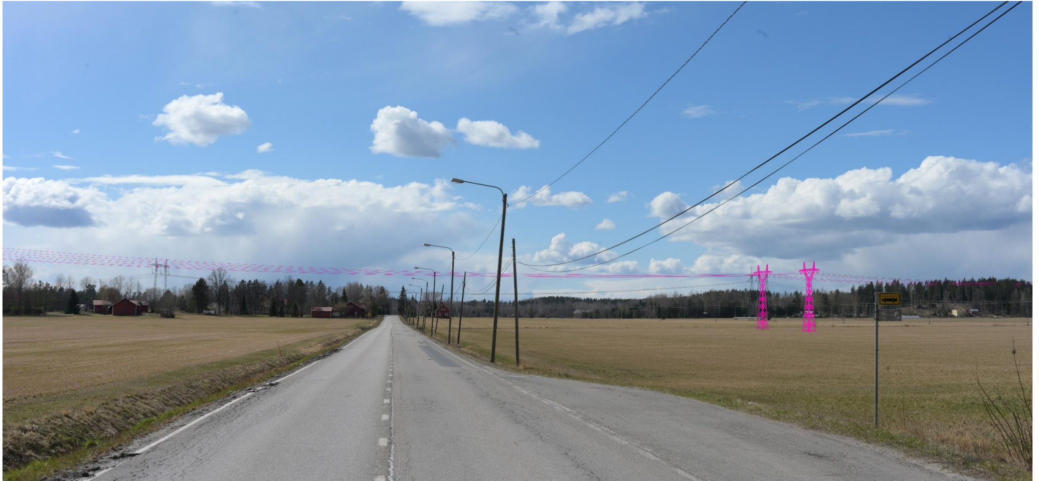
Kuva 16. Havainnekuva Pertuntieltä länteen. Voimajohdot (VE2) on korostettu vaaleanpunaisella.