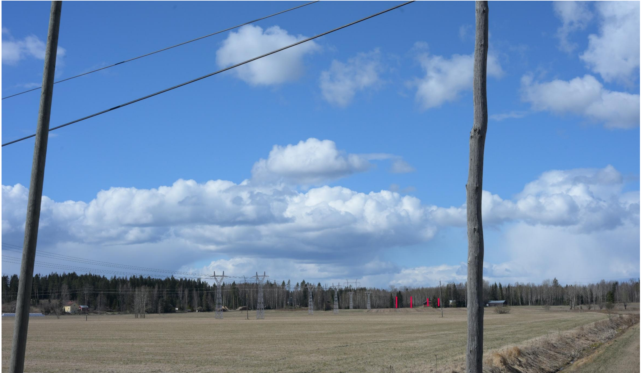
Kuva 9. Havainnekuva Pertuntieltä luoteeseen Ojalantien kohdalta (VE1). Puuston taakse jäävät voimajohtopylväät on korostettu punaisella.