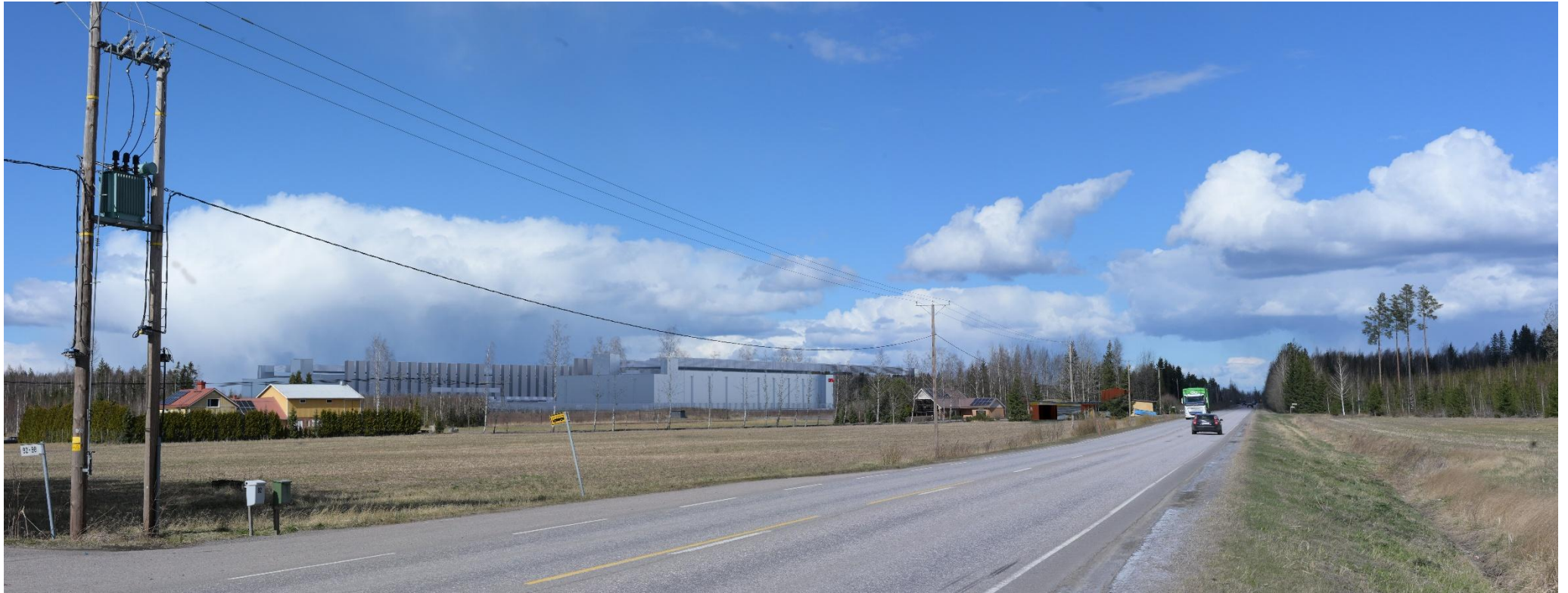
Kuva 2. Havainnekuva Ridasjärventieltä pohjoiseen kohti datakeskusalue (VE1).