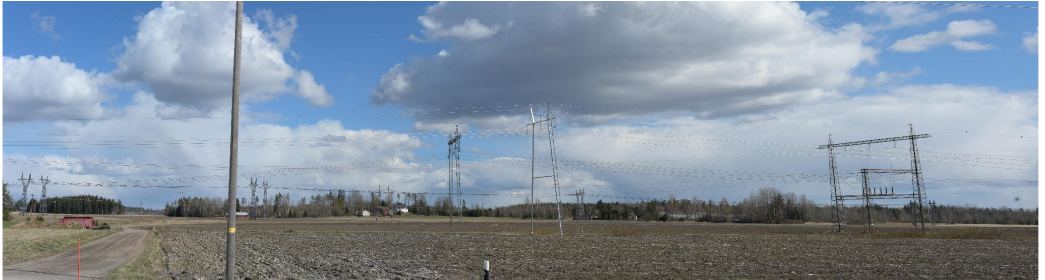
Kuva 17. Havainnekuva Hämeentieltä itään Kuoppanummentien kohdalta (VE1).