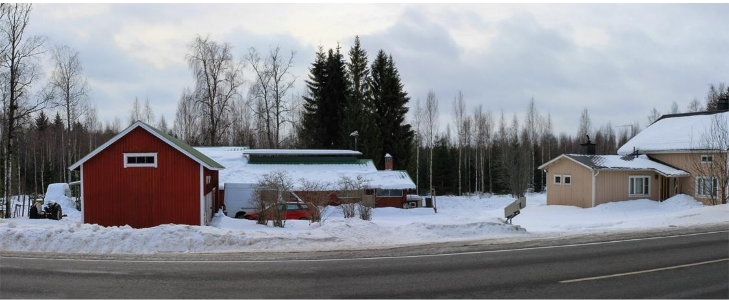
Kuvat Vaasantien varresta Huhtalan alueelta, josta etäisyyttä lähimmälle voimalalle on 1,4 km (TM12). Havainnekuivissa on esitetty myös puuston taakse jäävät tuulivoimat.