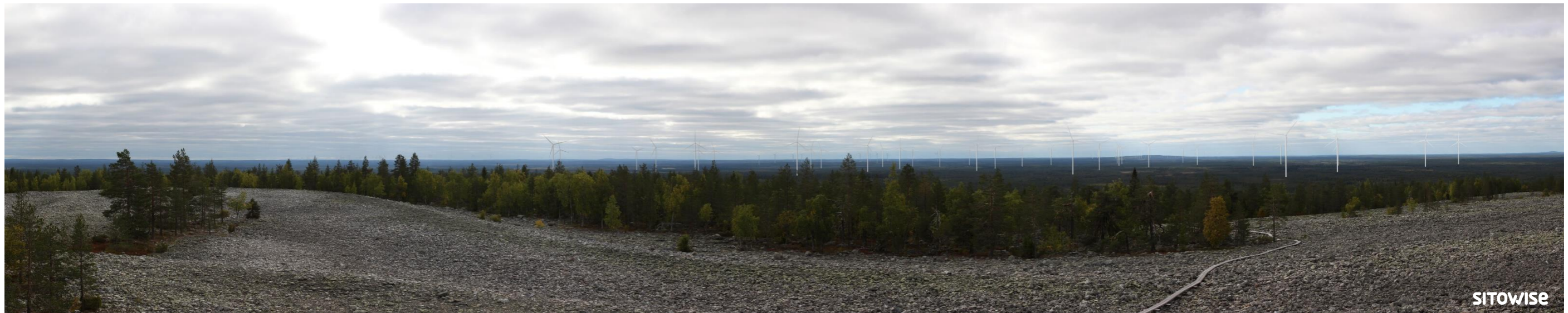
Kuva 10.1. Laajan yleisnäkymän esittävä havainnekuva yhteismallinnuksesta.