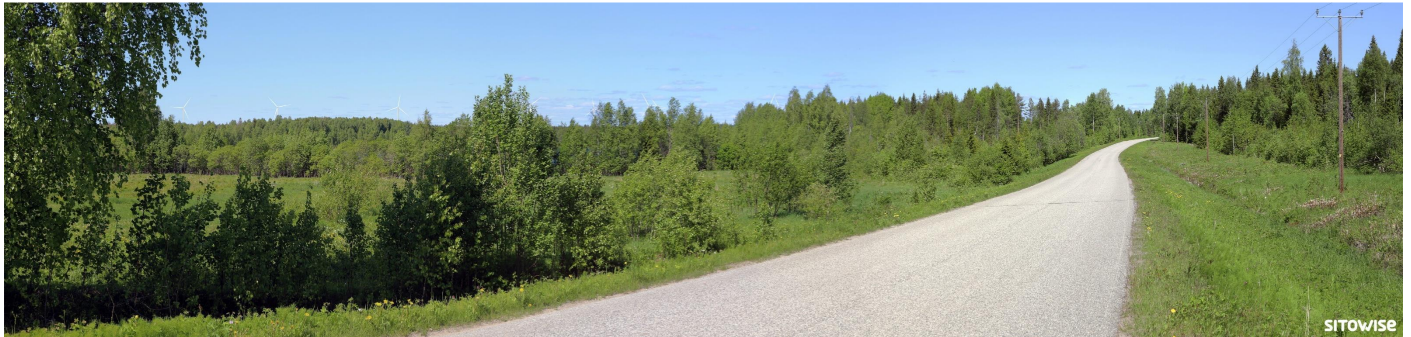
Kuva 11.1. Laajan yleisnäkymän esittävä havainnekuva yhteismallinnuksesta.