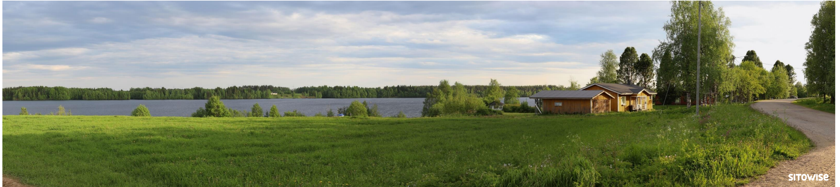
Kuva 6.1. Laajan yleisnäkymän esittävä havainnekuva yhteismallinnuksesta.