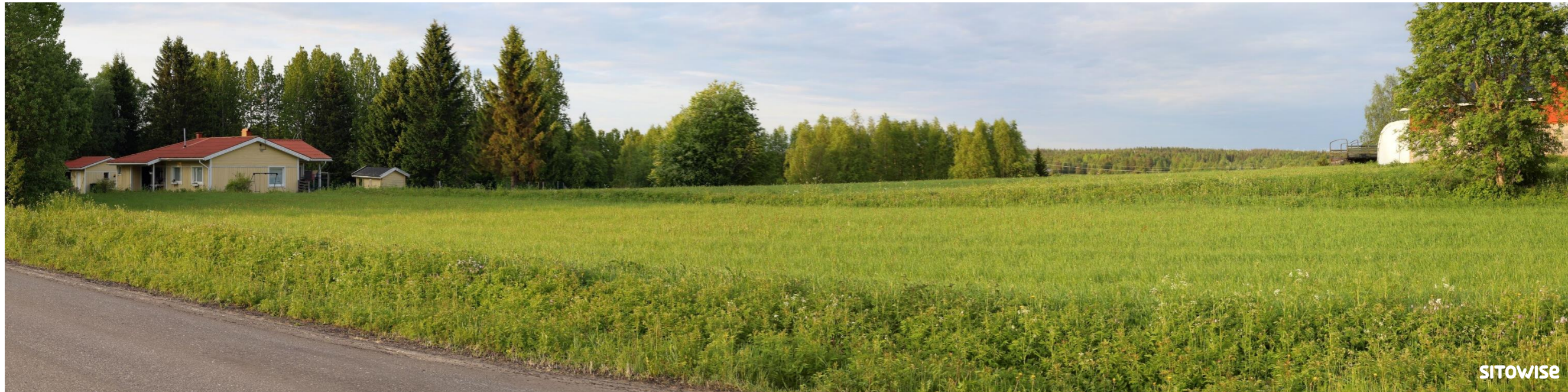
Kuva 9.3. Laajan yleisnäkymän esittävä havainnekuva yhteismallinnuksesta.