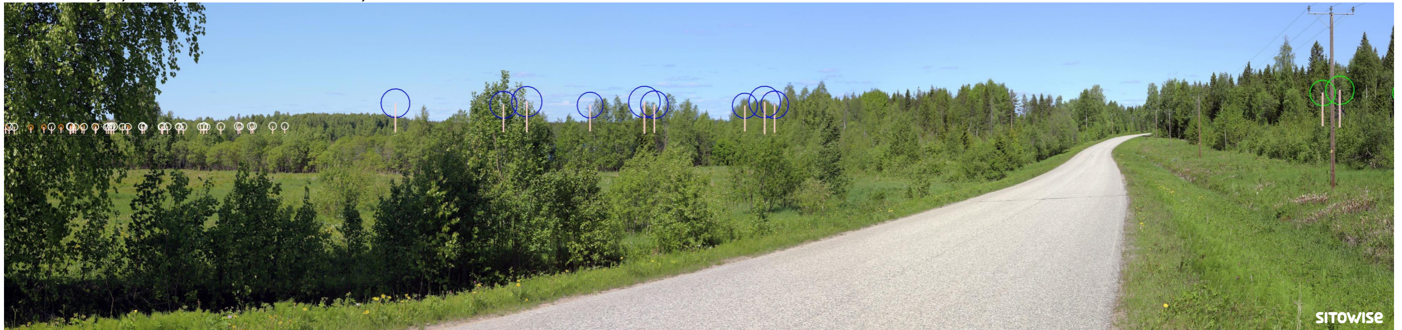
Kuva 11.4. Mallinnus tuulivoimaloiden sijainnista valokuvan päälle. Kuvassa on korostettu voimaloiden tornit valkoisilla viivoilla ja lapojen pyörimisaluet ympyröillä alla olevan selitteen mukaisilla väreillä.