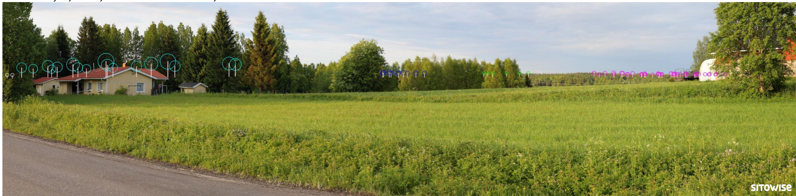
Kuva 9.4. Mallinnus tuulivoimaloiden sijainnista valokuvan päälle. Kuvassa on korostettu voimaloiden tornit valkoisilla viivoilla ja laojen pyörimisaluet ympyröillä alla olevan selitteen mukaisilla väreillä.