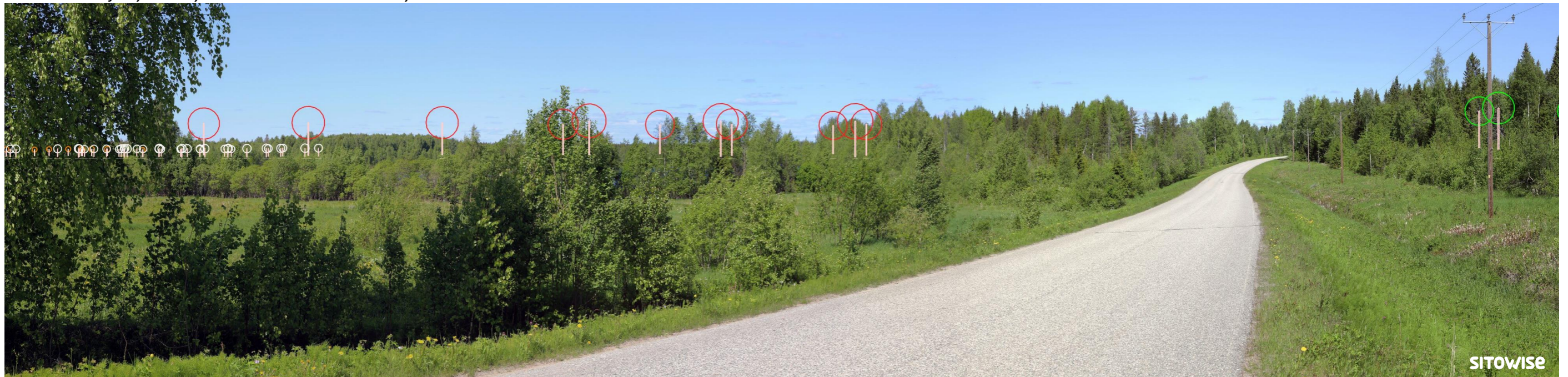
Kuva 11.2. Mallinnus tuulivoimaloiden sijainnista valokuvan päälle. Kuvassa on korostettu voimaloiden tornit valkoisilla viivoilla ja lapojen pyörimisalueet ympyröillä alla olevan selitteen mukaisilla väreillä.