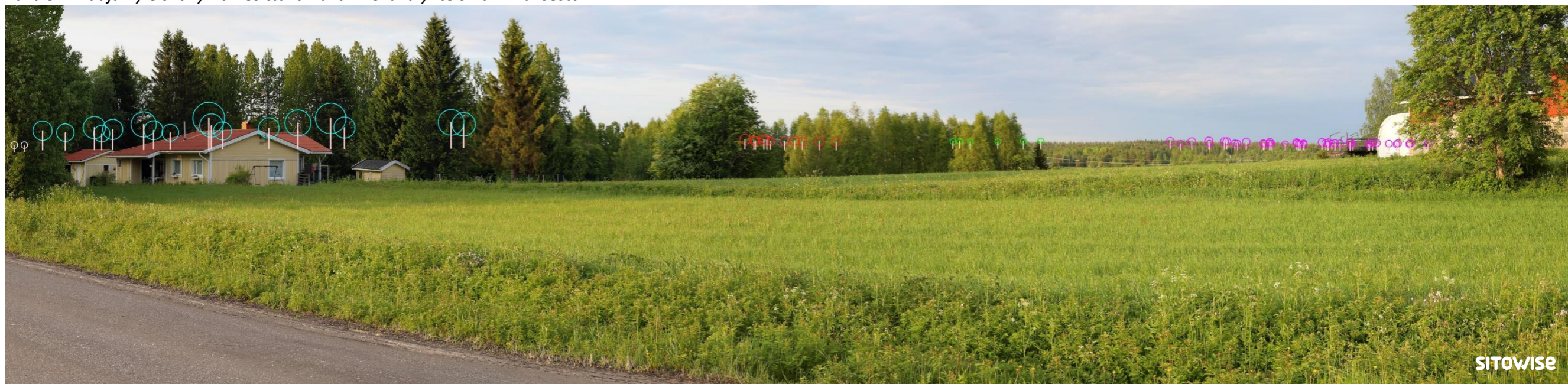
Kuva 9.2. Mallinnus tuulivoimaloiden sijainnista valokuvan päälle. Kuvassa on korostettu voimaloiden tornit valkoisilla viivoilla ja lapojen pyörimisaluet ympyröillä alla olevan selitteen mukaisilla väreillä.