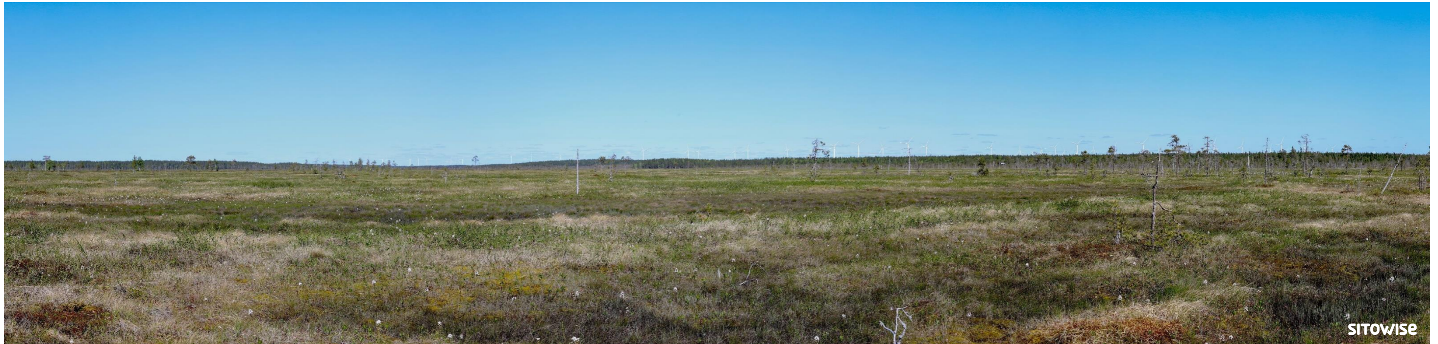
Kuva 8.3. Laajan yleisnäkymän esittävä havainnekuva yhteismallinnuksesta.