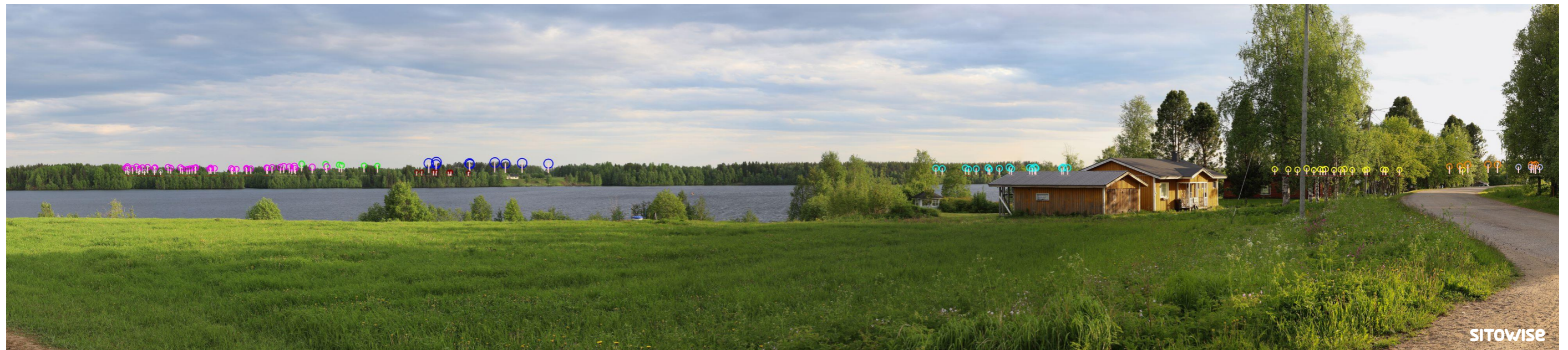
Kuva 6.4. Mallinnus tuulivoimaloiden sijainnista valokuvan päälle. Kuvassa on korostettu voimaloiden tornit valkoisilla viivoilla ja lapojen pyörimisaluet ympyröillä alla olevan selitteen mukaisilla väreillä.