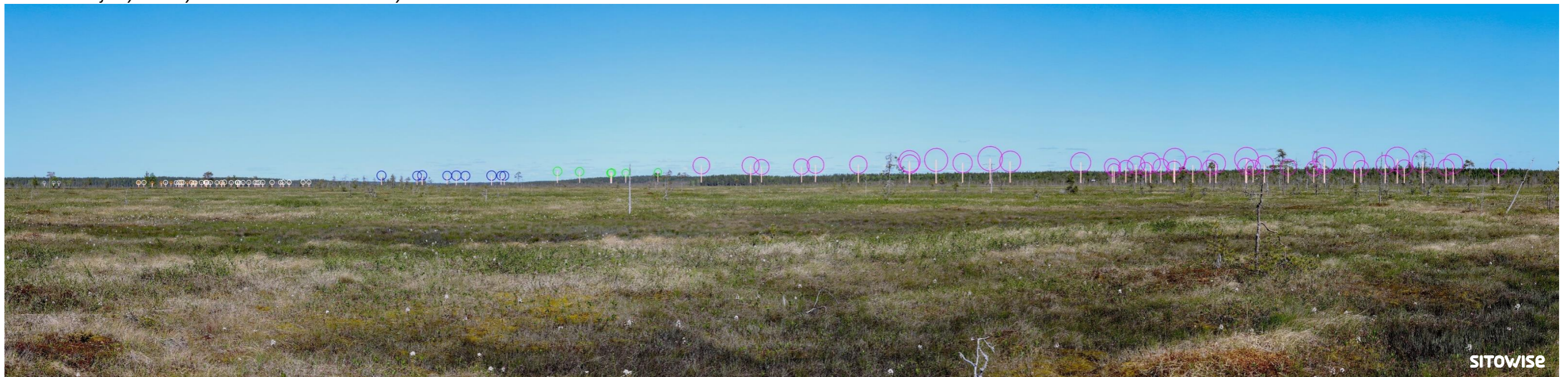
Kuva 8.4. Mallinnus tuulivoimaloiden sijainnista valokuvan päälle. Kuvassa on korostettu voimaloiden tornit valkoisilla viivoilla ja lapojen pyörimisalueet ympyröillä alla olevan selitteen mukaisilla väreillä.