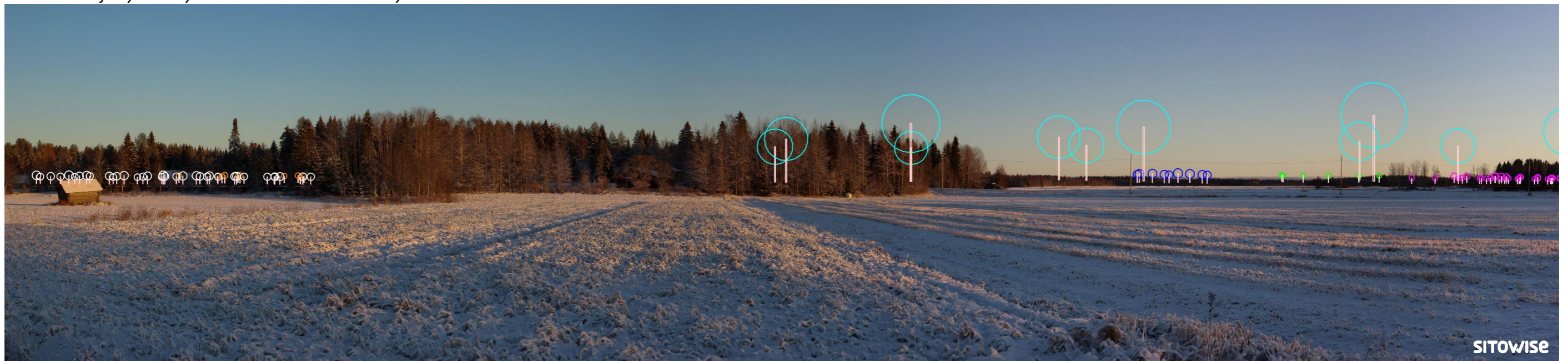
Kuva 7.4. Mallinnus tuulivoimaloiden sijainnista valokuvan päälle. Kuvassa on korostettu voimaloiden tornit valkoisilla viivoilla ja lapojen pyörimisaluet ympyröillä alla olevan selitteen mukaisilla väreillä.