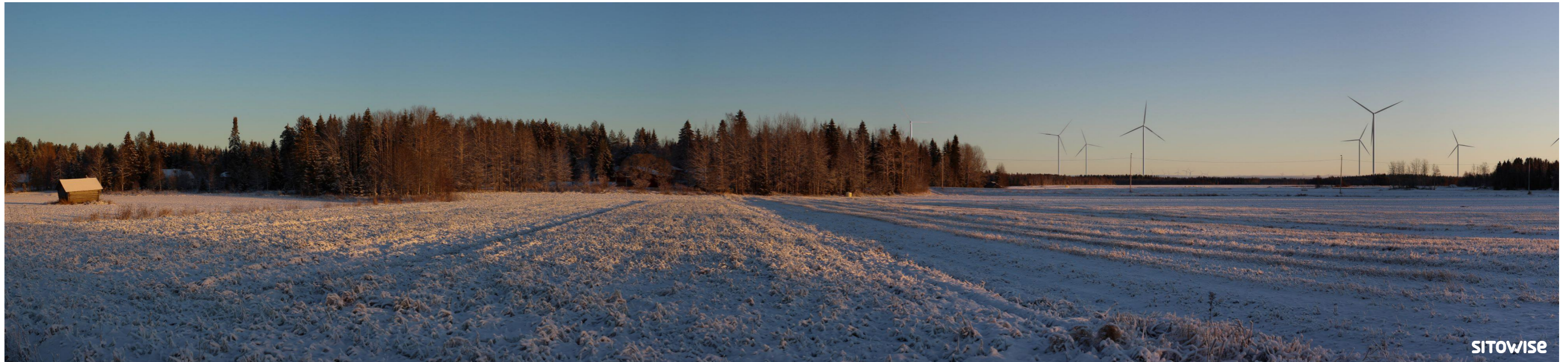
Kuva 7.1. Laajan yleisnäkymän esittävä havainnekuva yhteismallinnuksesta.