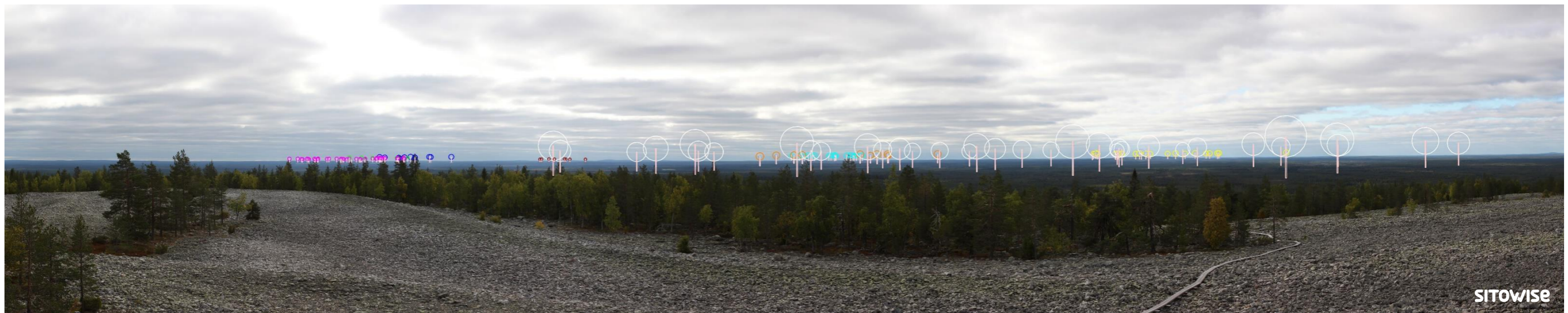
Kuva 10.4. Mallinnus tuulivoimaloiden sijainnista valokuvan päälle. Kuvassa on korostettu voimaloiden tornit valkoisilla viivoilla ja lapojen pyörimisaluet ympyröillä alla olevan selitteen mukaisilla väreillä.