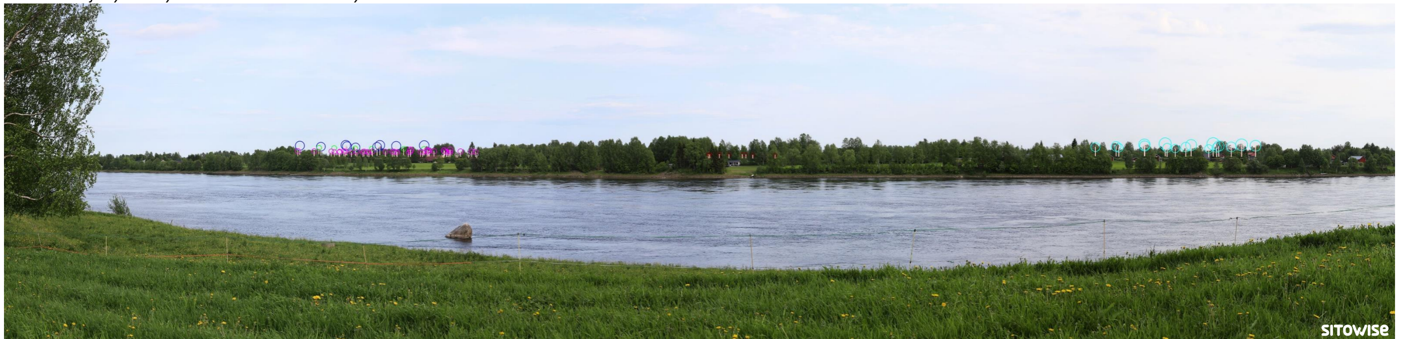
Kuva 5.4. Mallinnus tuulivoimaloiden sijainnista valokuvan päälle. Kuvassa on korostettu voimaloiden tornit valkoisilla viivoilla ja lapojen pyörimisalueet ympyröillä alla olevan selitteen mukaisilla väreillä.