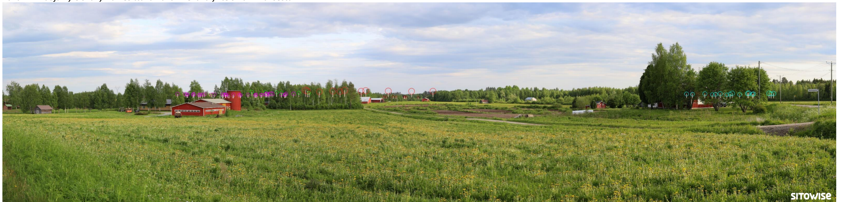
Kuva 4.2. Mallinnus tuulivoimaloiden sijainnista valokuvan päälle. Kuvassa on korostettu voimaloiden tornit valkoisilla viivoilla ja lapojen pyörimisaluet ympyröillä alla olevan selitteen mukaisilla väreillä.