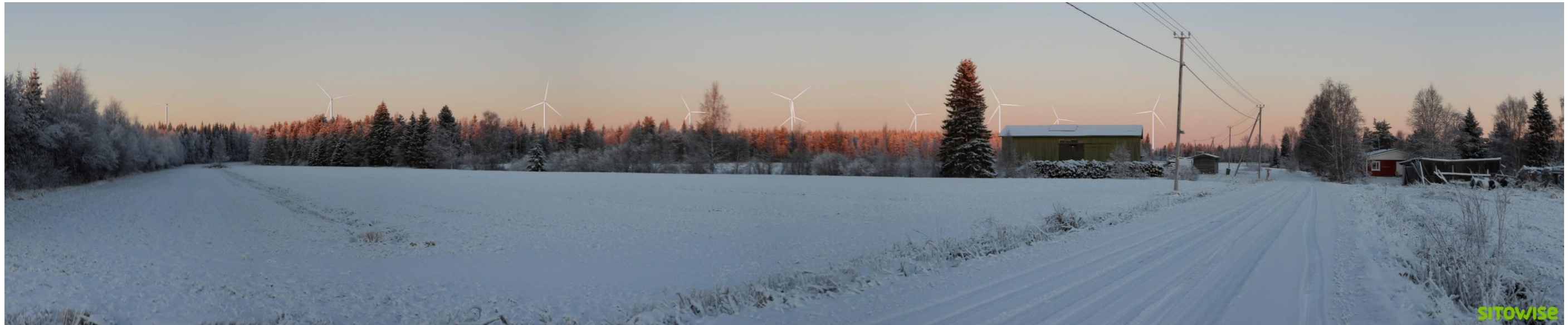
Kuva 1.1. Laajan yleisnäkymän esittävä havainnekuva yhteismallinnuksesta.