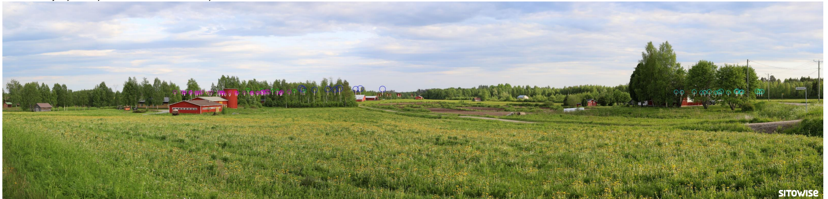
Kuva 4.4. Mallinnus tuulivoimaloiden sijainnista valokuvan päälle. Kuvassa on korostettu voimaloiden tornit valkoisilla viivoilla ja lapojen pyörimisaluet ympyröillä alla olevan selitteen mukaisilla väreillä.