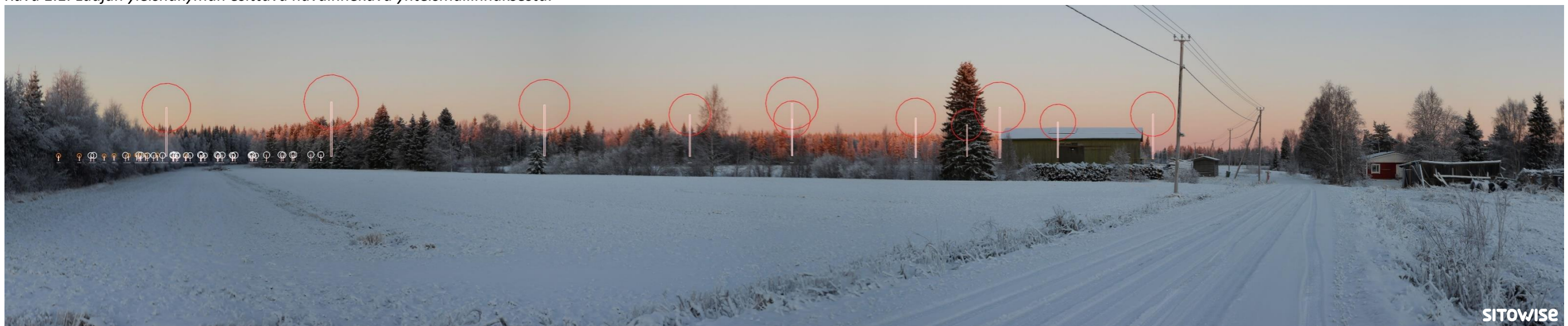
Kuva 1.2. Mallinnus tuulivoimaloiden sijainnista valokuvan päälle. Kuvassa on korostettu voimaloiden tornit valkoisilla viivoilla ja lapojen pyörimisaluet ympyröillä alla olevan selitteen mukaisilla väreillä.