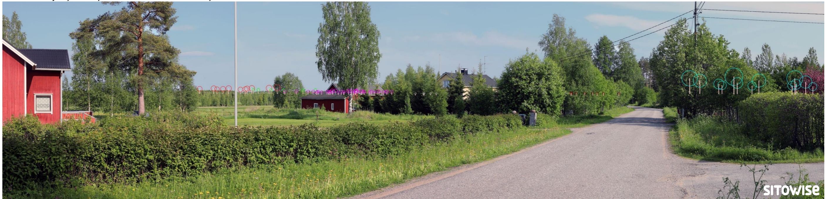
Kuva 3.2. Mallinnus tuulivoimaloiden sijainnista valokuvan päälle. Kuvassa on korostettu voimaloiden tornit valkoisilla viivoilla ja lapojen pyörimisalueet ympyröillä alla olevan selitteen mukaisilla väreillä.