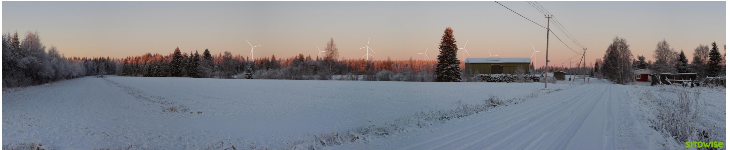
Kuva 1.3. Laajan yleisnäkymän esittävä havainnekuva yhteismallinnuksesta.