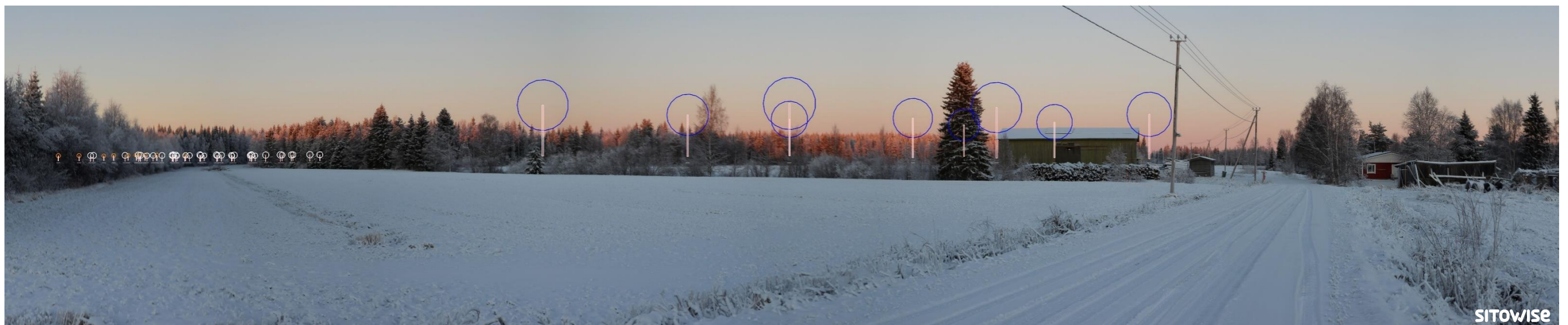
Kuva 1.4. Mallinnus tuulivoimaloiden sijainnista valokuvan päälle. Kuvassa on korostettu voimaloiden tornit valkoisilla viivoilla ja lapojen pyörimisalueet ympyröillä alla olevan selitteen mukaisilla väreillä.