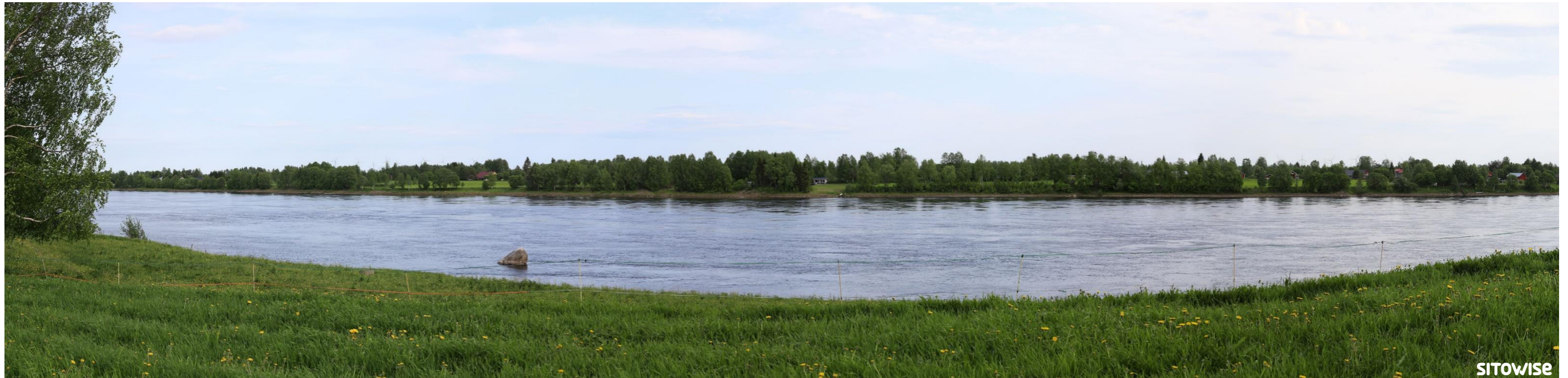
Kuva 5.3. Laajan yleisnäkymän esittävä havainnekuva yhteismallinnuksesta.