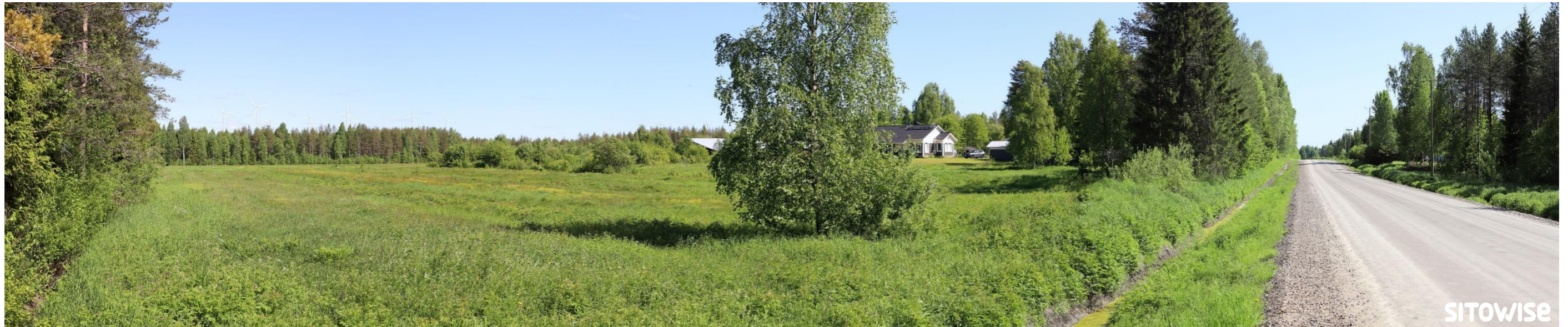
Kuva 2.3. Laajan yleisnäkymän esittävä havainnekuva yhteismallinnuksesta.