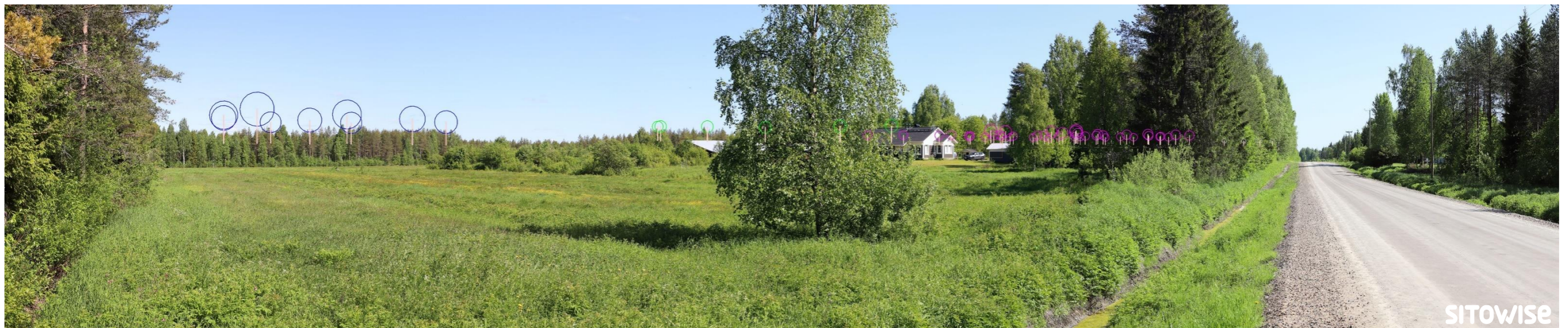
Kuva 2.4. Mallinnus tuulivoimaloiden sijainnista valokuvan päälle. Kuvassa on korostettu voimaloiden tornit valkoisilla viivoilla ja lapojen pyörimisaluet ympyröillä alla olevan selitteen mukaisilla väreillä.