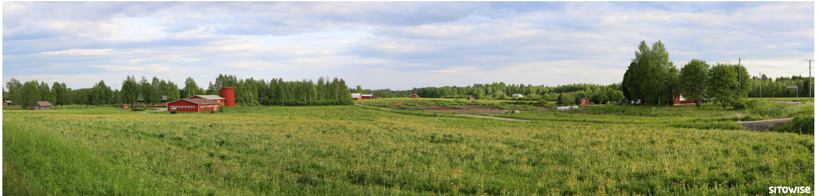
Kuva 4.3. Laajan yleisnäkymän esittävä havainnekuva yhteismallinnuksesta.