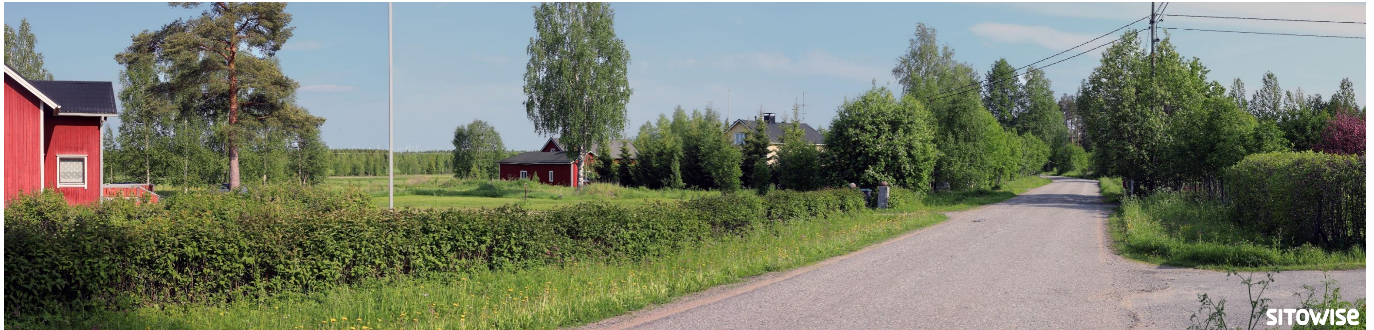
Kuva 3.3. Laajan yleisnäkymän esittävä havainnekuva yhteismallinnuksesta.