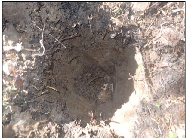
Kuva 13. Tegelbruksvikenin pohjoisosassa oleva kuusimetsä. Lapion kohdalla on koepisto, kuvattu luoteeseen. Kuva 14. Em. koepiston kuoppa. Maaperä on humuksen jälkeen karkeaa hiekkamaata.