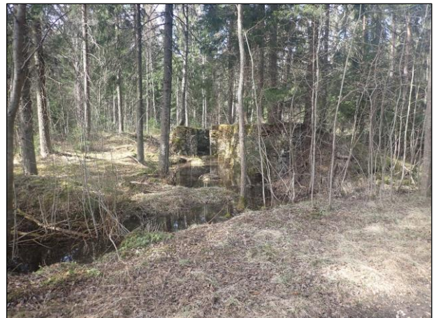
Kuva 17. Tiiliruukin seinämä ja huone, kuvattu itään. Kuva 18. Tiiliruukki kuvattuna lähimmältä metsäautotieltä, kuvattu luoteeseen.