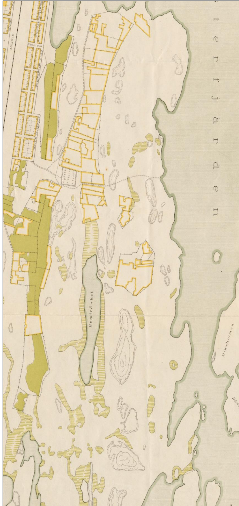
Kartta 3. Ote vuoden 1785 Kaskisten kaupungin kartasta. Tutkimusalueella ei ole eikä sinne ole suunniteltu rakennuksia. Alueella on peltoja (keltainen rajaus ruutukaavan ulkopuolella).