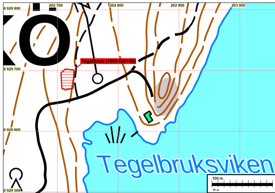
Kartta 6. Tegelbrukin kiinteä muinaisjäännösalue punaisella verkkokuvioilla.

Kuljukka 2023 inventointi: Kohde on säilynyt ennallaan.