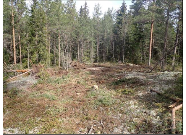
Kuva 5. Frimansträsketissä, tuotantoalueella oleva metsäautotie. Kuvattu pohjoiseen. Kuva 6. Frimansträsketin kallioista mäntymetsää. Kuvattu luoteeseen.