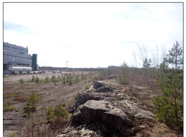
Kuva 3. Frimansträsket, kuvattu länteen. Kuva 4. Tehdasalueen ja metsikön reuna-alue. Kuvattu etelään.