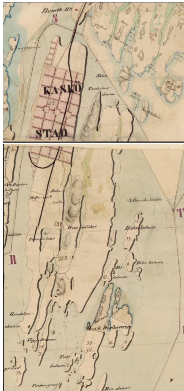
Kartat 4 ja 5. Otteet vuoden 1845 Närpiö-Kaskinen pitäjänkartasta. Tutkimusalueelle ei ole merkitty asutusta eikä muutenkaan arkeologisesti kiinnostavaa. Alueen länsikupeseen on merkitty lampurin talo, joka on nyt muinaisjäänös Herrmans Kronohemman.