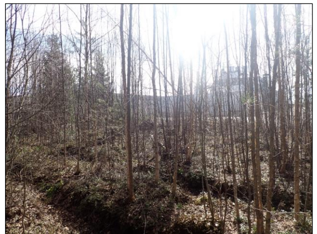
Kuva 1. Metsä group:in tuotantoalueen ja metsikön reuna-alue. Kuvattu luoteeseen. Kuva 2. metsikön reuna-alue, takana tuotantorakennus. kuvattu luoteeseen.