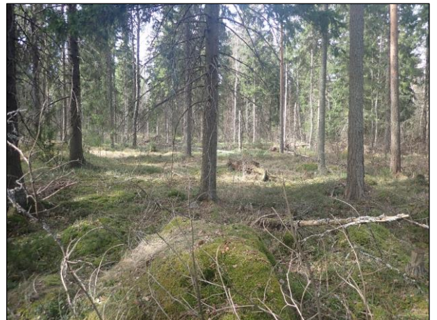
Kuva 9. Tegelbruksvikenin eteläpuoli, kuvattu itään. Nykyaikaisen betonipohjaisen rakennuksen jäännös. Kuva 10. Tegelsbrukin eteläpuoli, rannikon länsipuolella oleva metsä, kuvattu länteen.