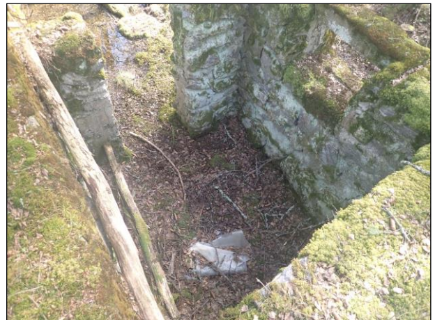
Kuva 15. Tiiliruukin kaakkoiskulma, kuvattu luoteeseen. Kuva 16. Tiiliruukin seinän luoteiskulmassa oleva huone.