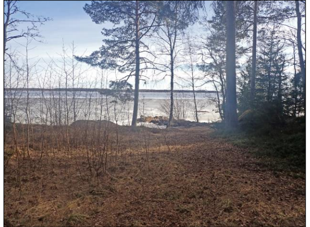
Kuva 11. Tutkimusalueen pohjoispuoli. Rannikolle johtava metsätie, kuvattu itään. Kuva 12. Itäinen rannikkoalue, kuvattu itään.