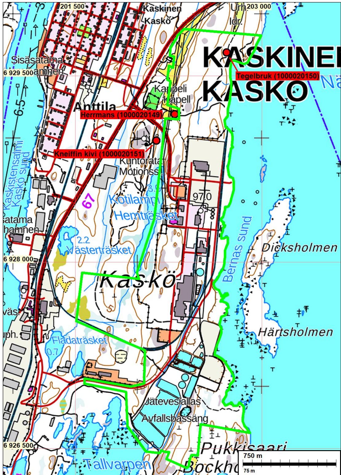
Kartta 2. Inventointialue rajattu vihreällä, alueen sisällä koillisosassa oleva kiinteä muinaisjäänös: Kaskinen Tegelbruk (historiallinen tiilenpolttouuni, mj. rek. 1000020150).