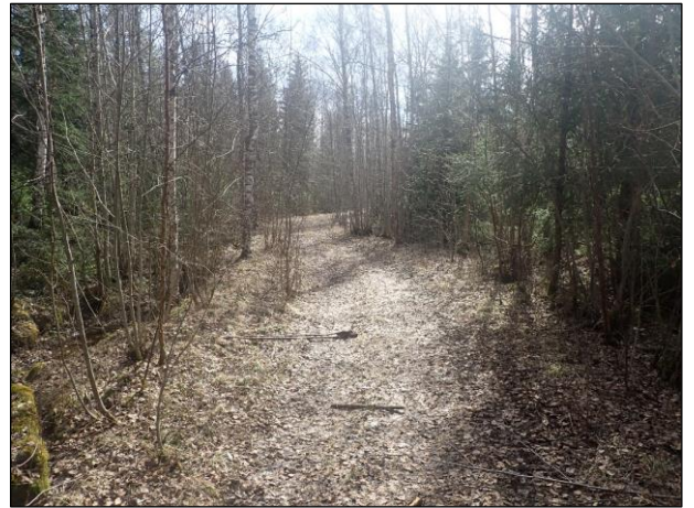
Kuva 7. Tuotantoalueelle johtavan tien itäpuolella olevaa metsikköä. Tehdasalueen luoteispuoli, kuvattu luoteeseen. Kuva 8. Herrmans Kronohemmanin kaakkoispuolella oleva metsäautotie. Kuvattu kaakkoon.