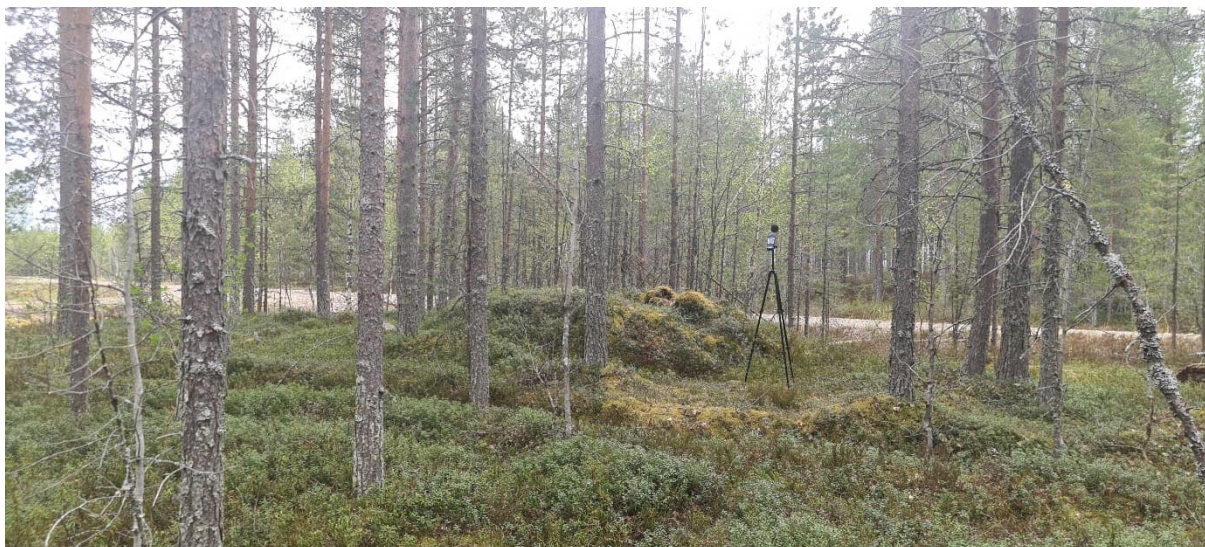
Kuva 6. Mittauspiste P5.