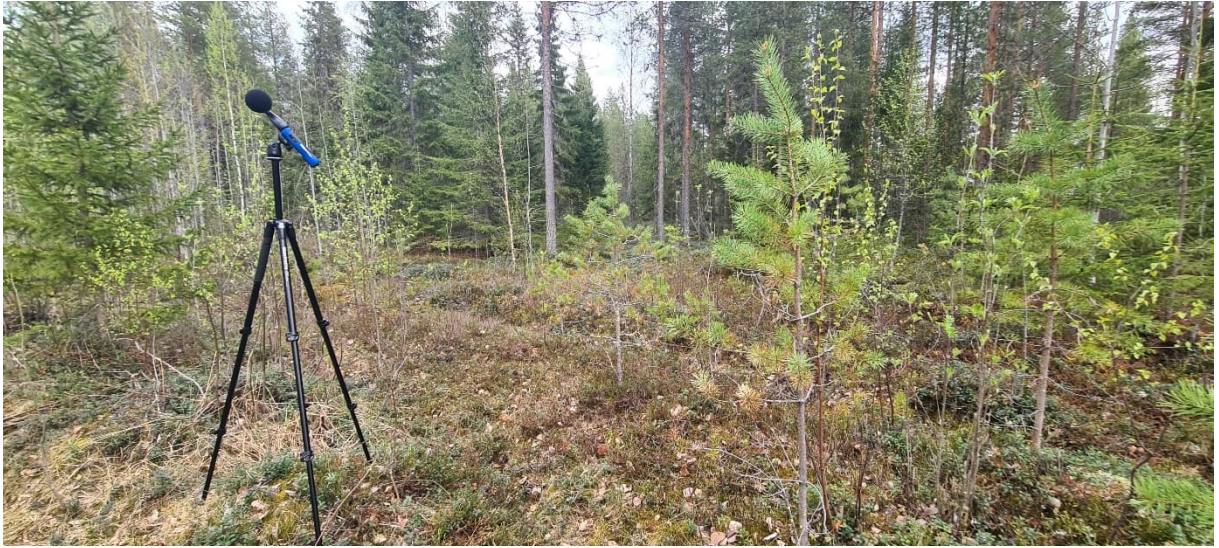
Kuva 3. Mittauspiste P2.