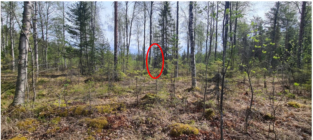
Kuva 2. Mittauspiste P1. Äänitasomittarin sijainti on merkitty punaisella.