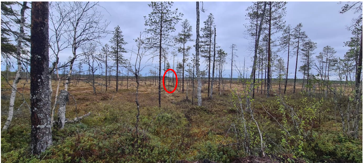
Kuva 5. Mittauspiste P4. Äänitasomittarin sijainti on merkitty punaisella.