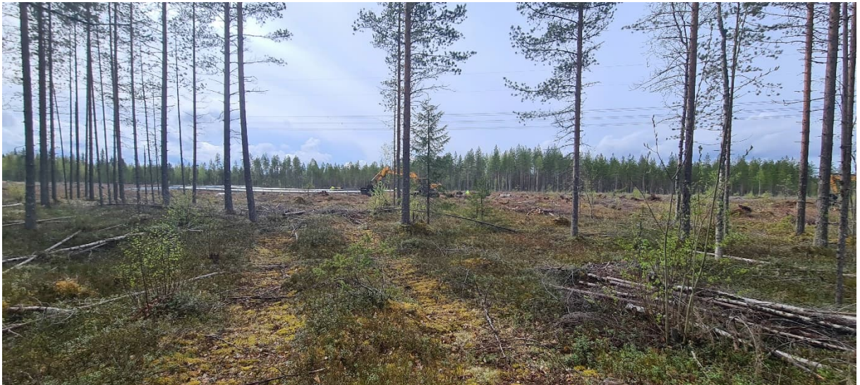
Kuva 4. Valokuva mittauspisteeltä P3, johon kantautui metsätyökoneen ääntä