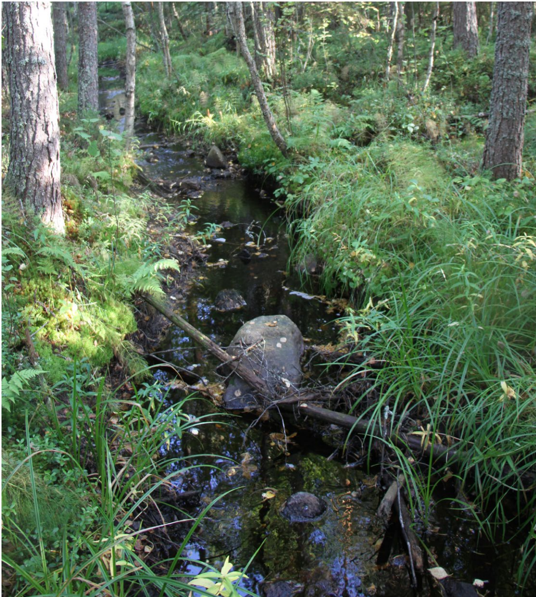
Yleiskuva Arpaisenpuron ylityspaikalta

Tilauksen ajankohdan vuoksi nyt toteutettu saukkoinventointi toteutettiin kulkemalla sähkönsiirtolinjauksen alueella olevien purojen ja pikkujokien rannat kahteen kertaan kauttaal-