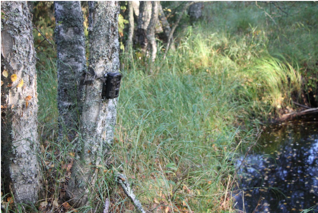
Riistakamera Härkäjoen varrella

Kummallakaan suunnitellulla sähkönsiirtoreitillä ei tehty havaintoja saukoista ja yksikään tutkitusta vesikohteesta ei sovellu saukkojen lisääntymisympäristöksi. Alueen purot ja pikkujotot ovat kesäaikaan hyvin niukkavetisiä. Alueella tehtyjen havaintojen ja kalastus selvityksen perusteella valtaosa vesiuomista on kalattomia tai hyvin niukkakalaisia. Erityisesti lisääntymisaikana saukko vaatii päivittäin runsaasti ravintoa. Aikuinen saukkoyksilö syö päivittäin 1-1.5 kiloa kalaa, eikä yhdenkään tutkitun puron tai vesiuoman kalantuotto riitä tähän. Saukot saattavat käyttää alueen vesiuomia alueen läpi kulkiessaan järviolueelta toiselle.