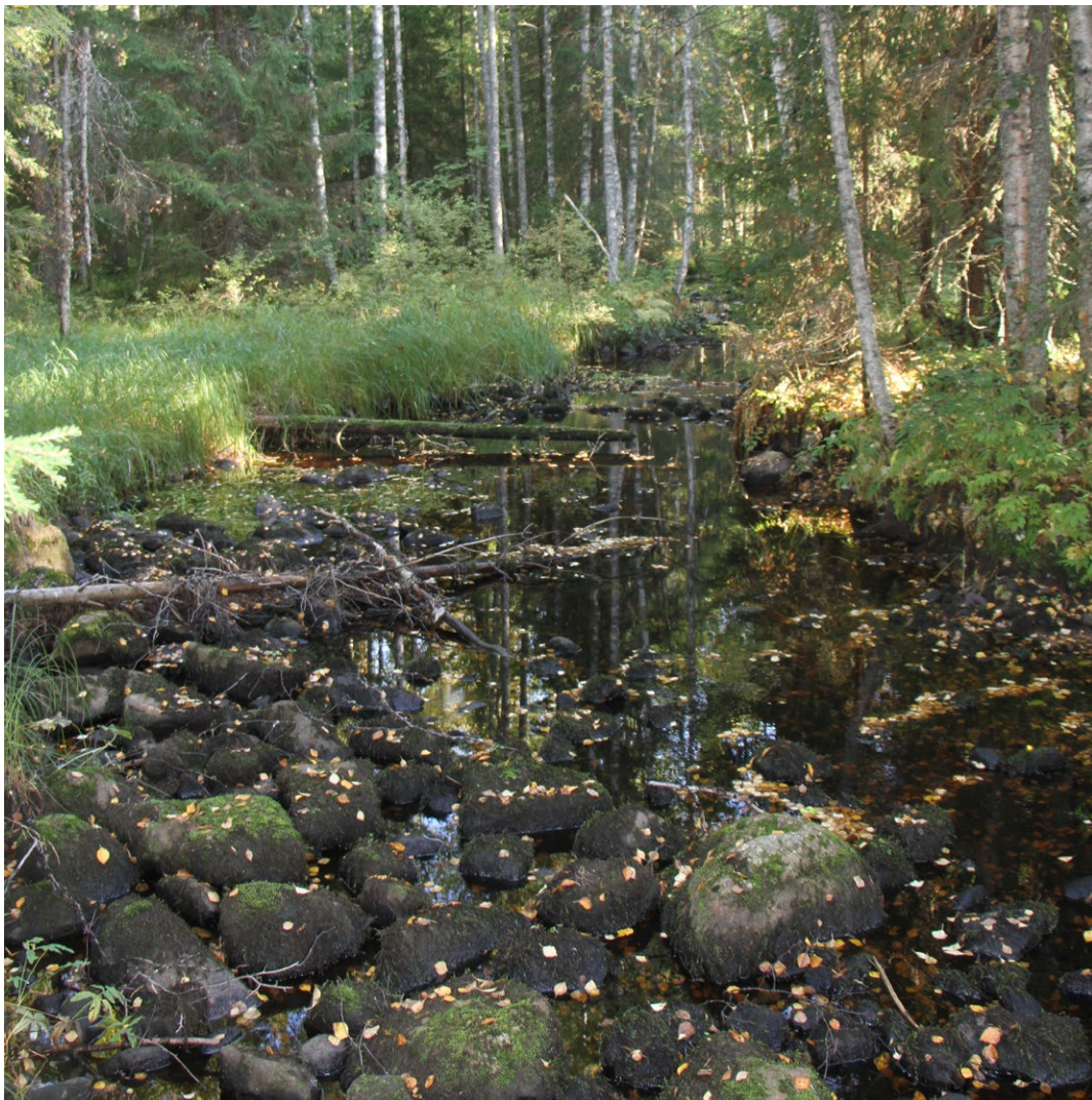
Mustikkakoski Maintaisenjoen varrella

Suunniteltu sähkönsiirtolinjaus ylittää Maintaisenjoen Mustikkakosken kohdalla. Kosken alue on kivikkoista ja tällä joki on melko leveä. Koskipaikalle on kasaantunut tulvan tuomia puunrunkoja, joista osassa näkyi majavan vanhoja ruokailujälkiä. Koskipaikan yläpuolella on pitkä ja melko matala svantoalue, jonka reunoilla on hieman rehevämpää kasvillisuutta. Suvannon reunalla kasvaa viiltosaraa ja alueelta löytyi myös myrkkyykeisoskasvusto. Koski-