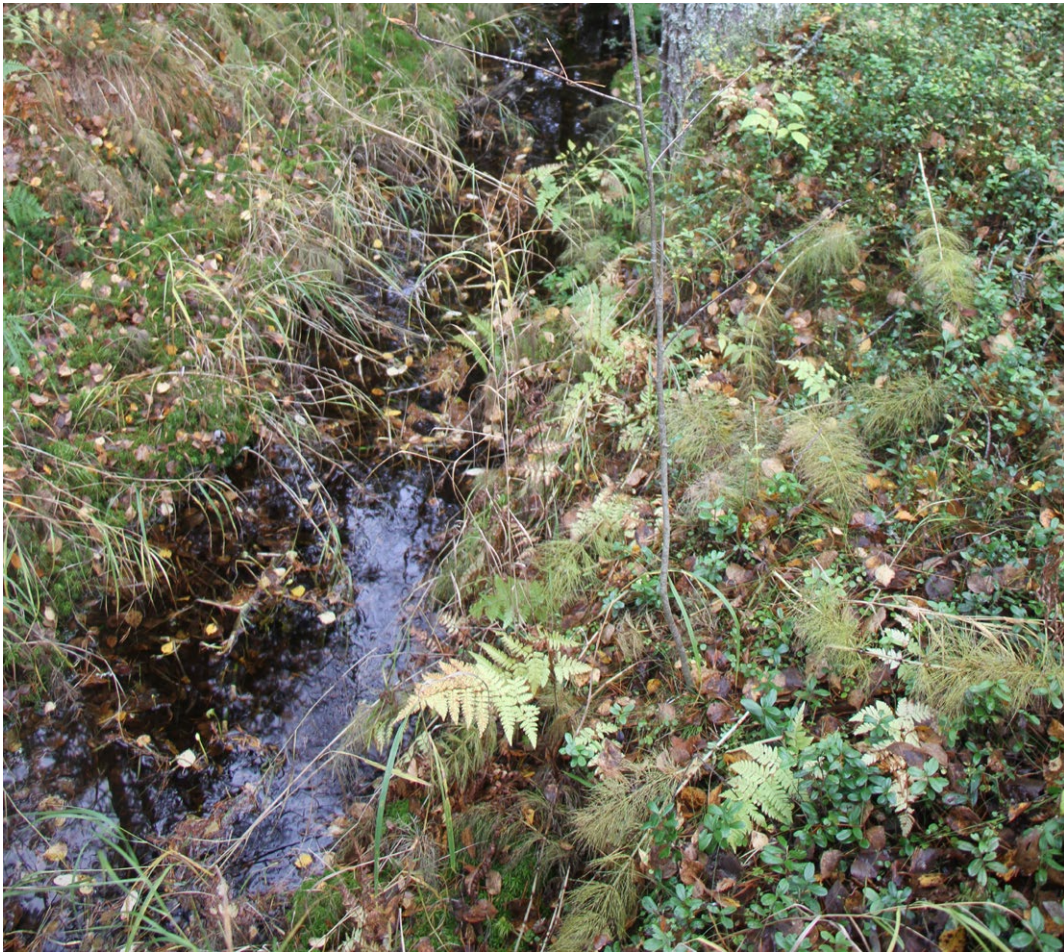
Yleiskuva Kattilapuron varrelta

Alueella ei havaittu merkkejä saukkojen esiintymisestä, eikä uoman alueella tehty kalahavaintoja. Vesiuoman varressa ei ole saukon pesintään sopivia maakoloja tai muita suojaisia alueita.