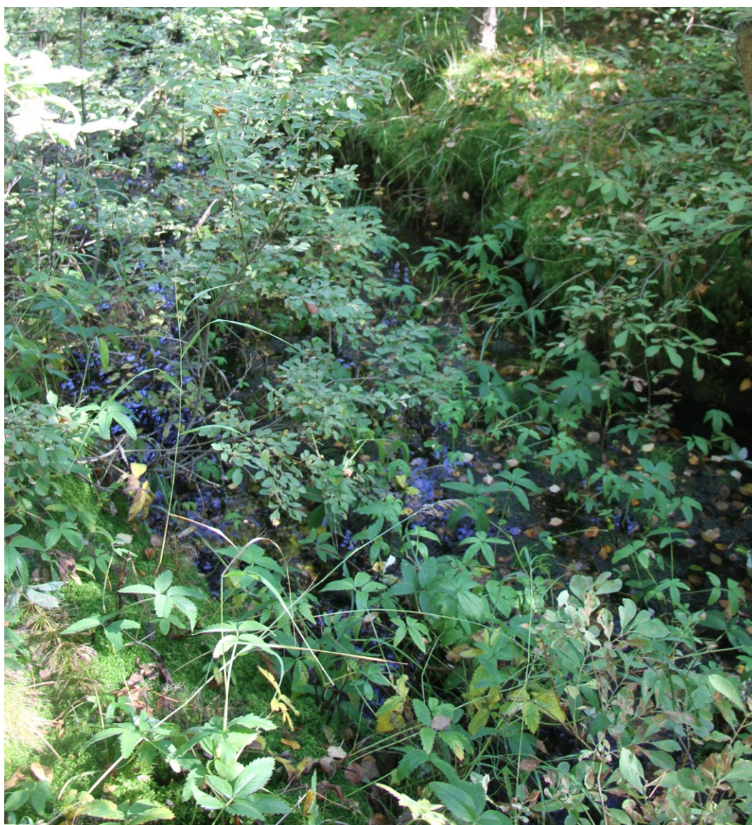
Mustalamminpuro on hyvin niukkavetinen

Alueella ei havaittu merkkejä saukkojen esiintymisestä, eikä uoman alueella tehty kalahavaintoja. Vesiuoman varressa ei ole saukon pesintään sopivia maakoloja tai muita suojaisia alueita.