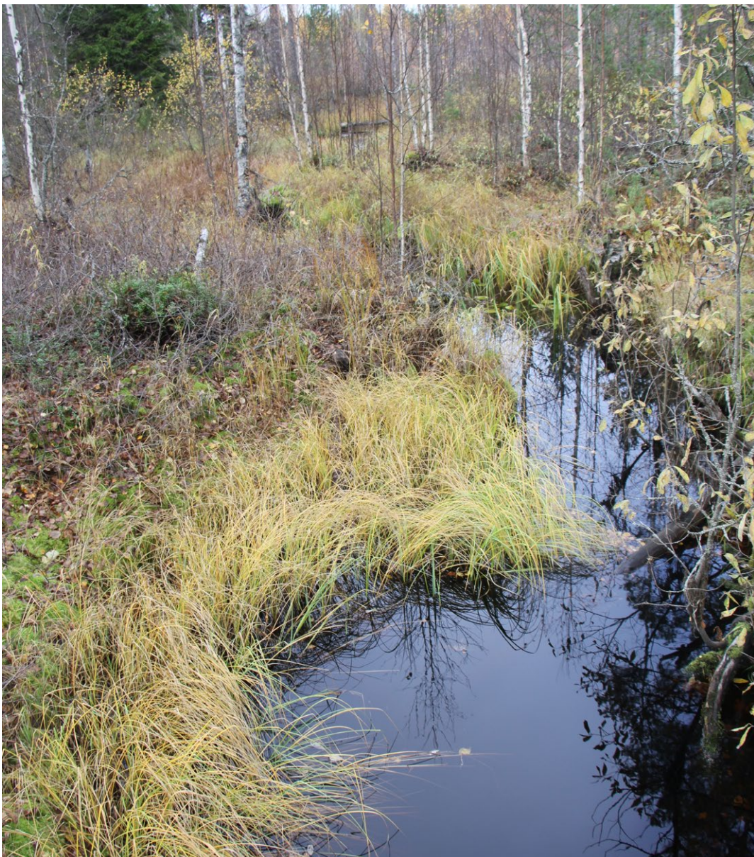
Yleiskuva Arpoisen moreeniharjanteen vieressä kulkevasta vesiuomasta. Kuva sillan pohjoispuolelta