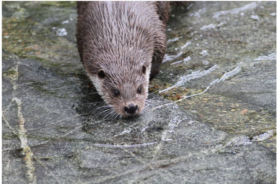
Saukosta ei tehty havaintoja alueella