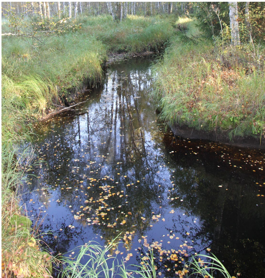
Härkäjokea reunustaa kapea heinäkorpireunus

Alueen runsasvetisin vesiuoma, jossa vettä oli myös heinäkuun ensimmäisellä käynnillä runsaasti. Sähkösiirtolinjauksen ylityspaikalla joki on luonnontilainen ja jokivartta reunustaa hieskoivuvaltainen turvekangas, joka on leveimmillään joen länsipuolella. Joen itäpuolella