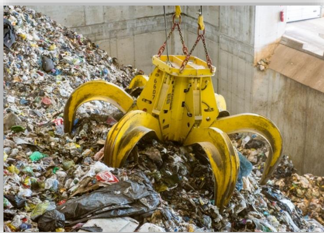
Kuva 2. Jätettä jätebunkkeriin syöttävä kahmari.

Poltettavat jätteet toimitetaan laitokselle lähialueilta pakkaavilla jäteautoilla; pidemmällä matkoilla hyödynnetään jätteen siirtokuormausta. Jätteen laadun varmistamiseksi laitokselle tulevia kuormia vastaanotettaessa tehdään pistokokein jätekuormien tarkastuksia sekä lämpöarvomäärityksiä. Jäte varastoidaan polttolaitoksella vastaanottobunkkeriin, jossa on tarkoitukseen soveltuva, kestävä seinä- ja pohjarakenne. Bunkkeriin vastaanotettu jäte murskataan tarvittaessa ennen syöttöä polttoon. Yleensä laitokselle saapuva syntypaikkalajiteltu jäte on polttokelpoista sellaisenaan. Jäte nostetaan siltanosturilla ns. kahmarilla (kuva 2) syöttösuppilon kautta poltettavaksi kattilan arinalle.