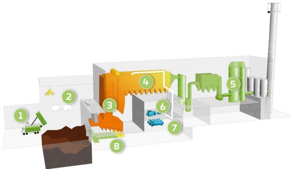
Kuva 1. Jätteenpolttolaitoksen läpileikkauskuva.

Polttolaitoksen prosessit jaetaan seuraavasti: jätteen vastaanotto, polttoprosessi, savukaasujen puhdistus ja turbiinilaitos (kuva 1).