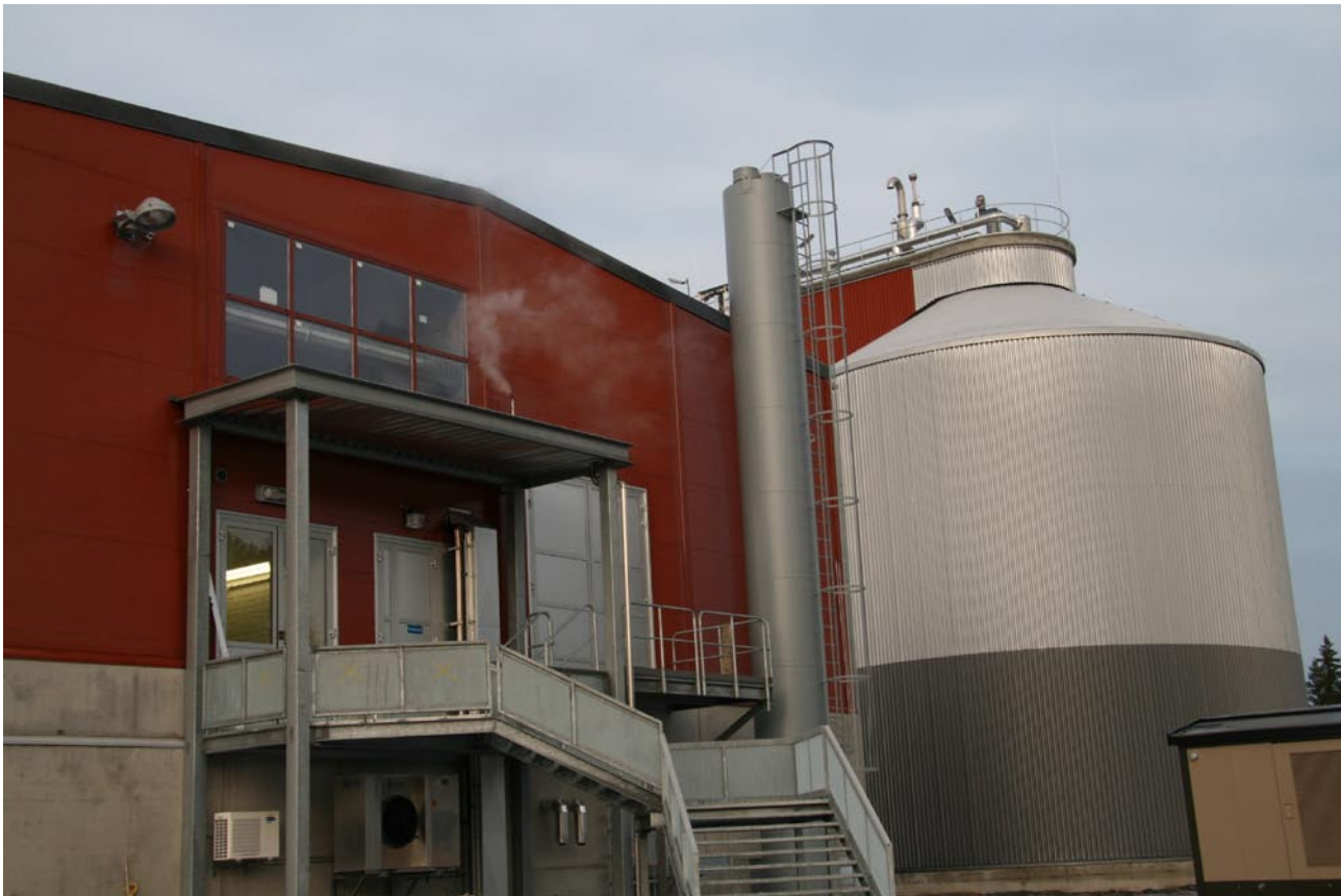
Lakeuden Etappi Oy:n biokaasulaitos.

Lietteet hyödynnetään nykyisin pääasiassa viherrakentamisessa, kaatopaikkojen maisemoinnissa ja maanviljelyssä. Muita mahdollisia hyödyntämistapoja ovat käyttö metsälannoitteina sekä poltto. Lannoitekäyttö edellyttää lietteiltä hyvää laatua ja materiaalin tuotteistamista.