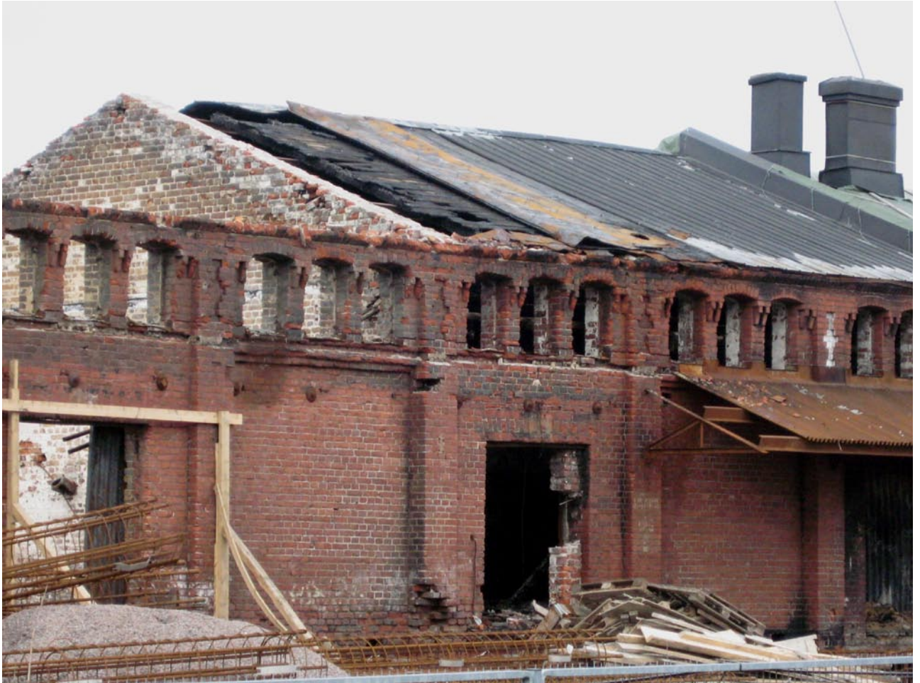
Makasiinien rakennustyömaa Helsingissä.

Korjausrakentamistarpeen ennustetaan kasvavan lähivuosien aikana. Eniten arvioidaan kasvavan asuinrakennusten korjaustarpeen, lähes 30 % nykytasosta. Vuonna 2006 korjausrakentamiseen käytettiin yli 7 miljardia euroa, mikä vastaa noin 40 prosenttia koko talonrakentamisen arvosta. Korjauksista yli puolet kohdistui asuinrakennuksiin. Ympäristöministeriön korjausrakentamisen strategiassa vuosille 2007–2017 tavoitteena on parantaa korjausrakentamisprosessin materiaalitehokkuutta.