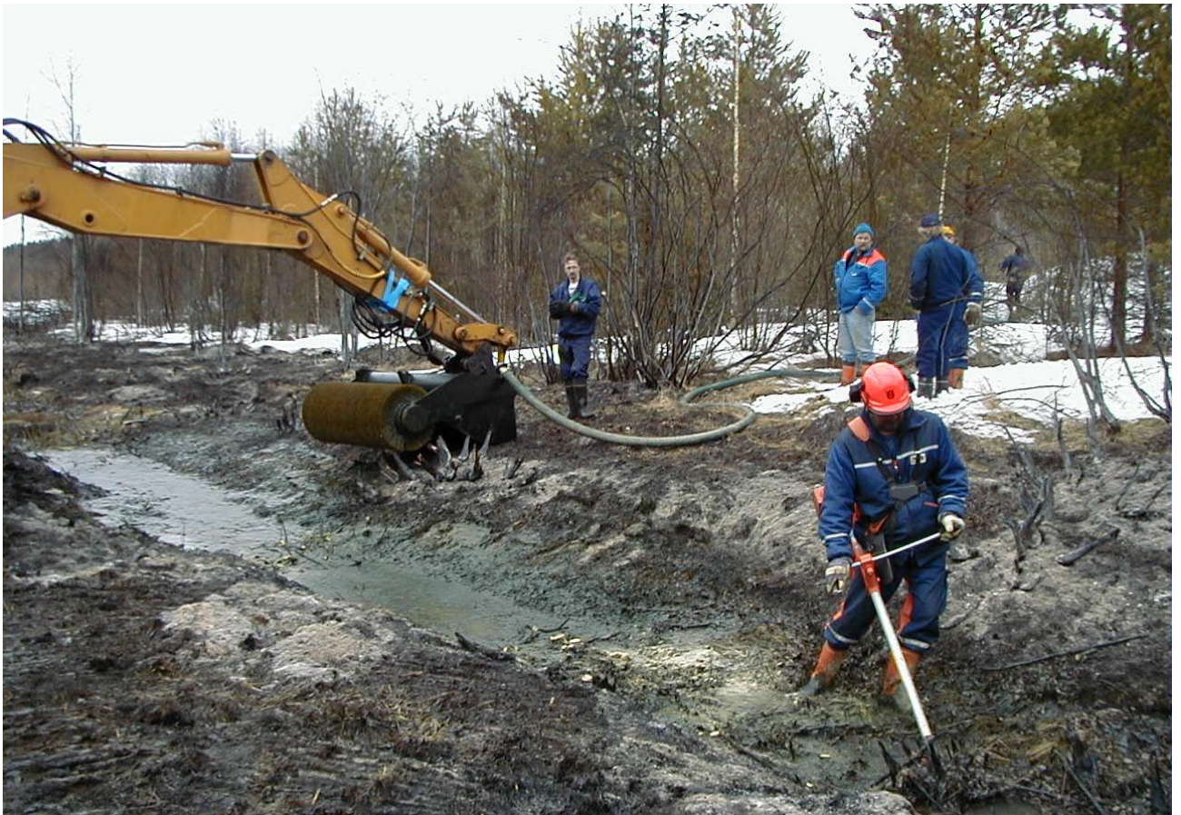
Öljyn keräystä kaivinkoneeseen.

Kuulemisen aikana tulleissa palautteissa, yhteistyöryhmissä sekä asiantuntijaryhmissä on ehdotettu useita esimerkkitapauksia jättesuunnitteluun. Resurssisyistä ei kaikkia poikkeuksellisia tilanteita ole mahdollista käsitellä tässä jättesuunnitelmassa.