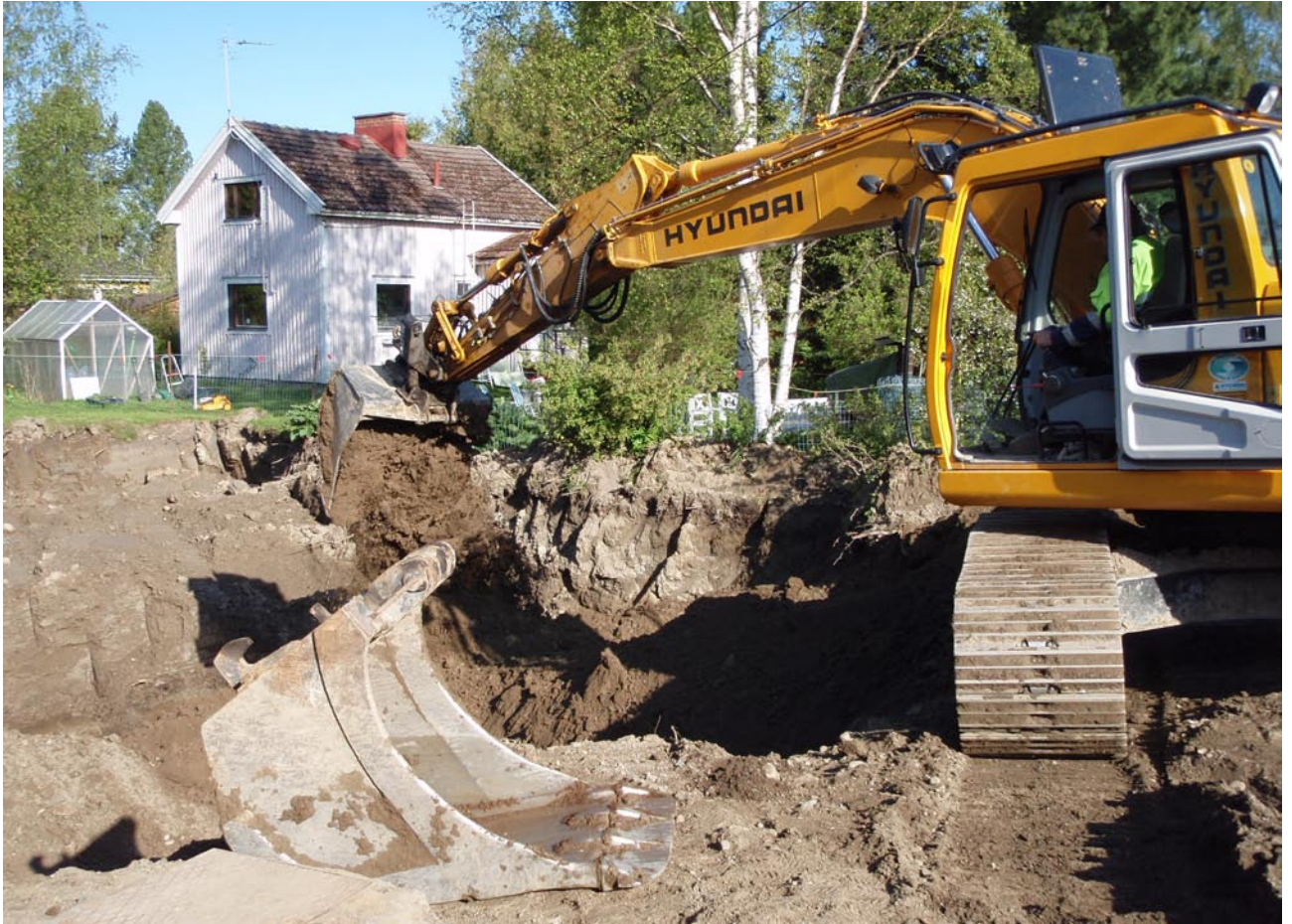
Pilaantuneen maan kunnostusta.