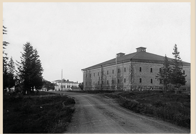
Kruununmakasiini 1930-luvulla.