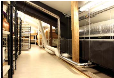
Ullakon ilmastointiputkistoa.

Rakentamisen nykymääräyksien noudattaminen toi mukanaan odottamattomia yllätyksiä tilan käyttöä suunniteltaessa. Sähköpääkeskukseen viemä tilamäärä yllätti, mutta ei kuitenkaan niin paljon kuin ilmanvaihtolaitteiden ahmaisema osuus vintin lattiapinta-alasta. "Se on ihan pyörityttävää, miten paljon nuo ilmastointiputket vievät tilaa" huokaa museonjohtaja. Jokainen laa-