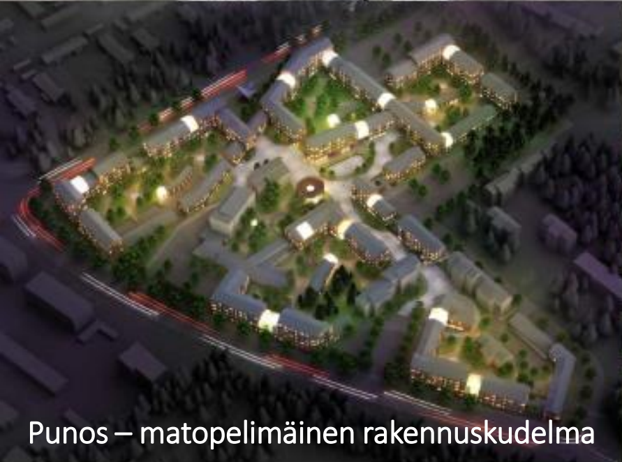
Punos – matopelimäinen rakennuskudelman