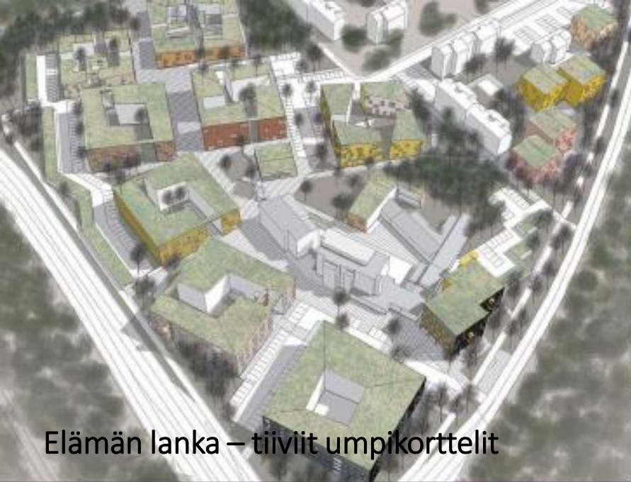
Elämän lanka – tiiviit umpikorttelit