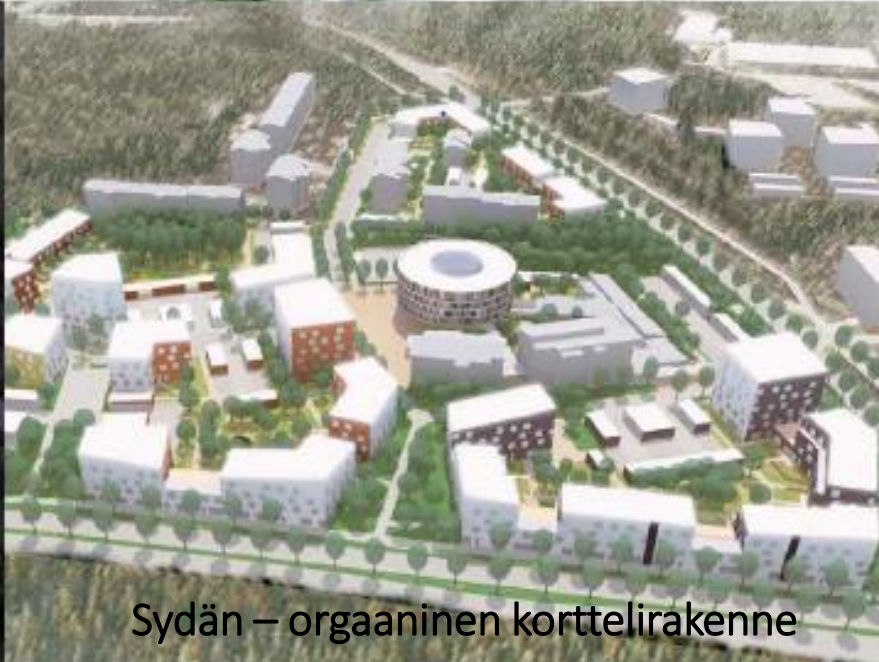
Sydän – orgaaninen korttelirakenne