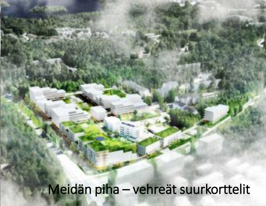
Meidän piha – vehreät suurkorttelit