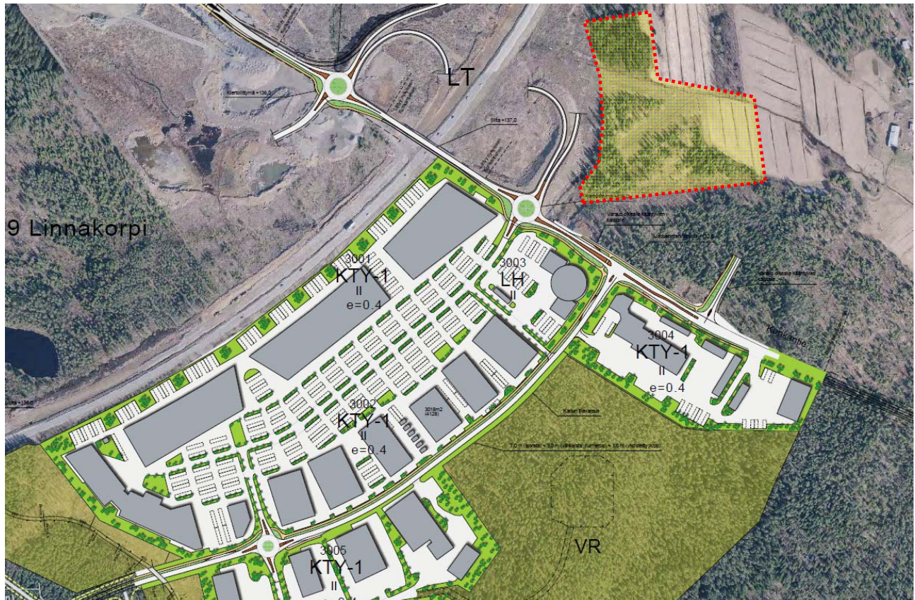
Ote kaavan nro 176 havainnekuvas ta ja aluerajaus johon läjityslupaa haetaan.