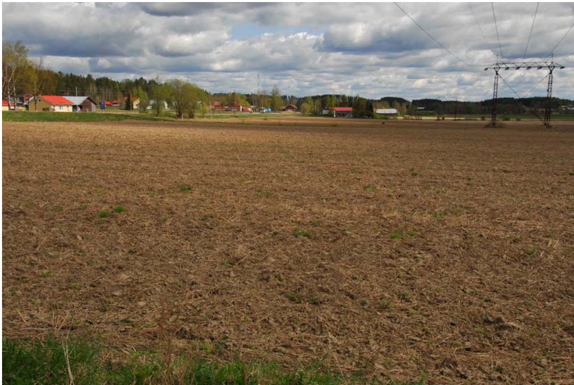
Tammela, Portaan kylä. Voimalinja kulkee kylän eteläpuoleisella peltoaukealla. Kuvattu lännestä.

Voimajohto kulkee Portaan suojelualueen läpi, mutta kuitenkin siinä määrin etelämpänä pellolla, että siellä tuskin on keskiaikaan tai historialliseen aikaan liittyviä jäännöksiä, ainakaan niistä ei ole merkintään kartta-aineistossa eikä mitään siihen viittaavaa myöskään löydetty inventoinnin yhteydessä.