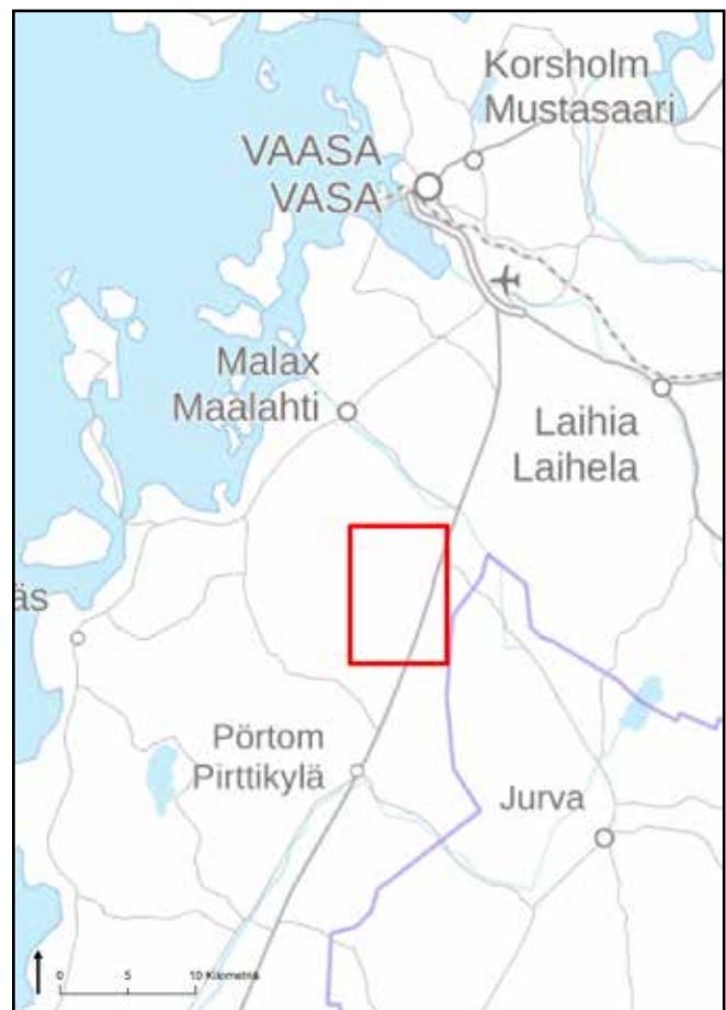
Kuva 1. Tutkimusalueen sijainti.

Tässä raportissa esitetään toukokuun alussa 2019 toteutetun viitasammakkoselvityksen tulokset. Raportti käsittää yleis- ja pohjatietojen lisäksi kuvaukset tutkimusmenetelmistä sekä inventointien tulokset ja mahdolliset maankäyttösuositukset.