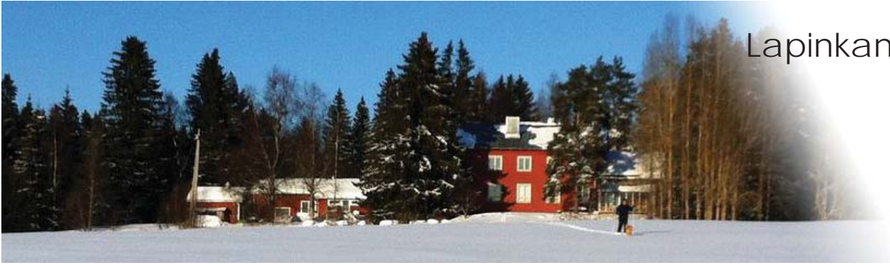
Lapinkankaan koulu Oulu

Oulujoen kunnan Lapinkankaan kylän koulu rakennettiin vuonna 1949 Kouluhallituksen tyyppiirustuksia soveltaen osittain kylälaisten talkoovoimin. Koulussa oli kaksi opettajaa, jotka opettivat ylä- ja alakoululaisia. Pihapiirissä oli myös ajan tapaan navetta opettajille, sauna, sekä ulkokuoneet. Koulutoiminta lakkasi 70-luvun alkupuolella, jonka jälkeen rakennus on toiminut kesäleiripaikkana ja kylälaisten kokoontumistiloina. Vuonna 1989 talo vuokrattiin Oulun Arkkitehtikillalle, jonka alivuokralaisina siinä asui ja työskenteli 5 arkkitehtiopiskelijaa ja valokuvaaja. Koulu myytiin tarjouskilpailun perustella yhteisössä asuneelle pariskunnalle vuonna 1994, jonka jälkeen sitä on kunnostettu heidän toimestaan työtiloiksi ja perheen asunnoksi.