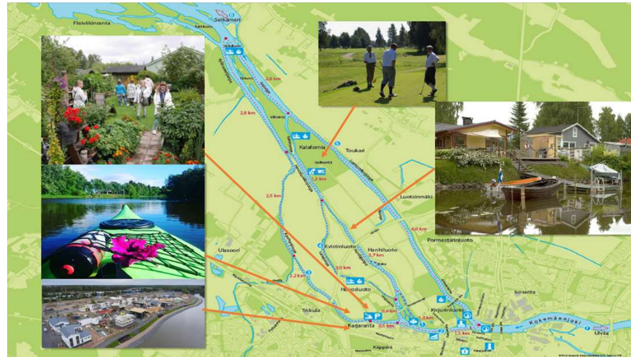
Kuva: Joitakin Porin suiston toimijaryhmistä