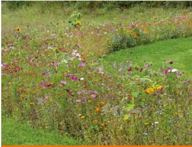
Luonnonvaraisia kukkapenkkejä pölyttäjille