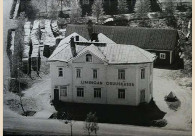
Ilmakuva Osuuskassasta, Limingan Osuuspankin omistuksessa.