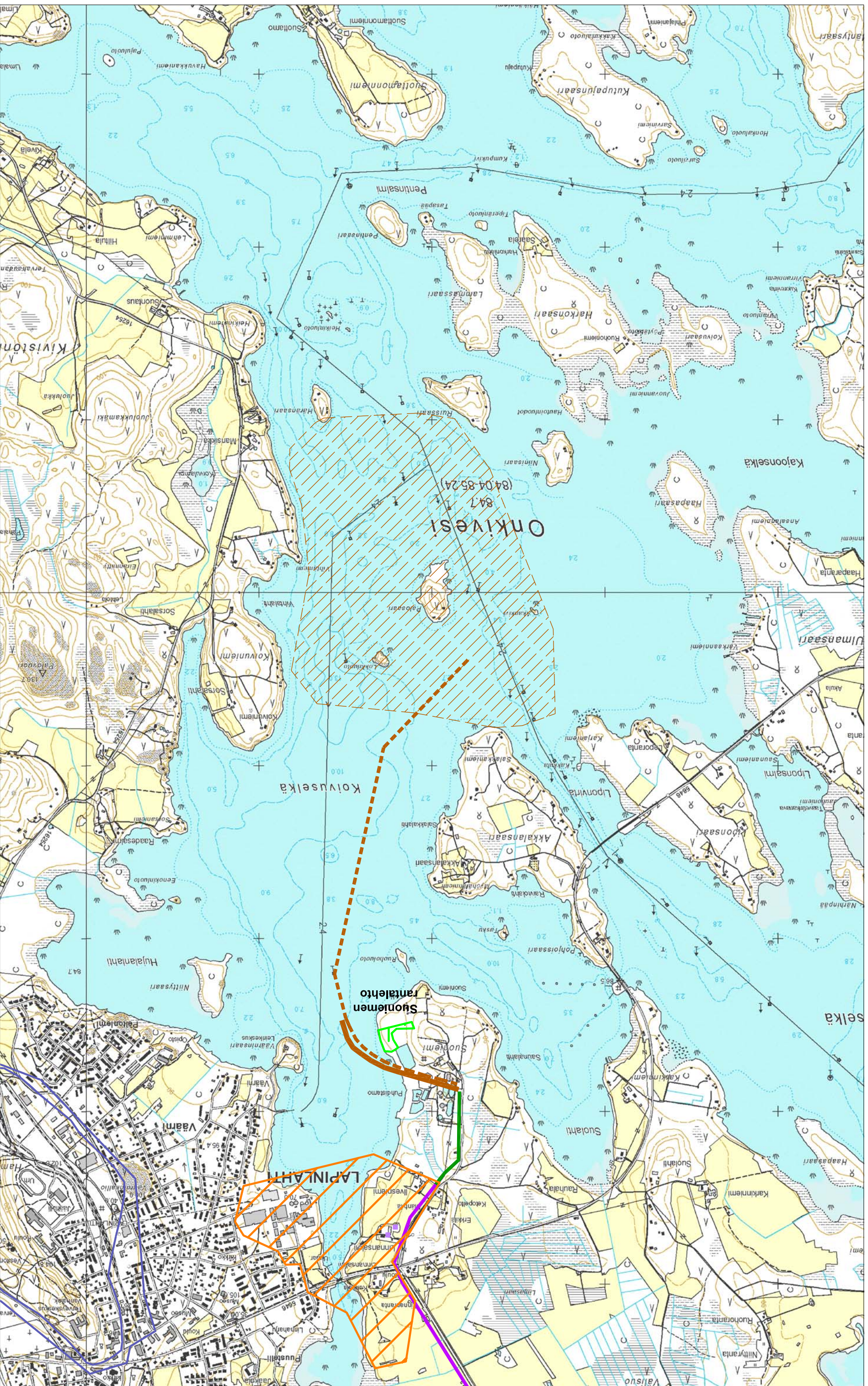
LIITE 4: YMPÄRISTÖKARTTA